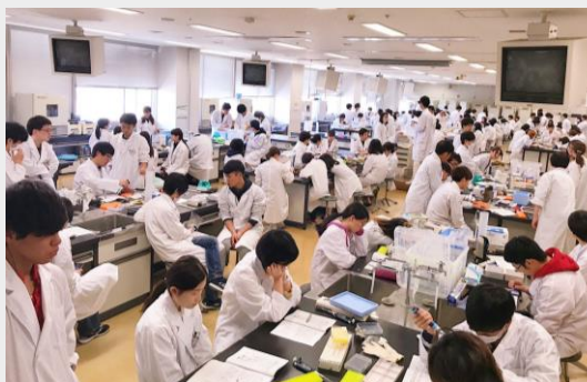
系上實驗課上課盛況