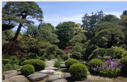
精心照顧的私人庭園