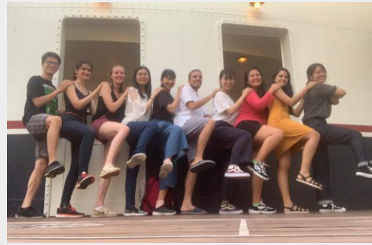
與大家一起來迪士尼