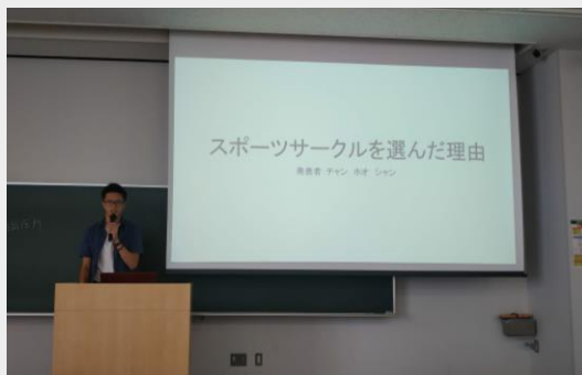
日本語課程上台報告

校外教學 則是每堂課都在各景點 介紹日本傳統文化及習俗 ，可從老師口中用英文聽到許多日本歷史，同時課堂中也能認識許多外籍生及日本同學。