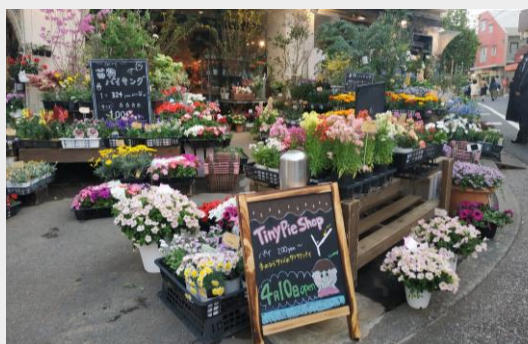
質感高級的路旁花店