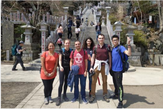
與外國朋友們一起爬山

每個週末或連假都會安排與外籍生及日本學生一同出遊，互相交換各自的文化趣事及未來規劃，並體驗各種不同休閒活動。