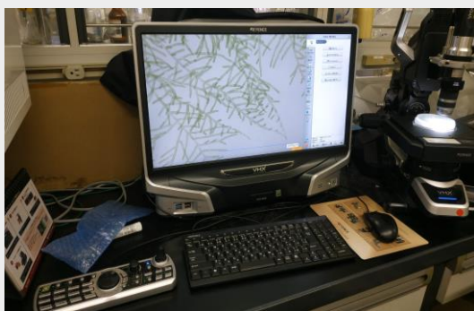
研究室實驗器材操作