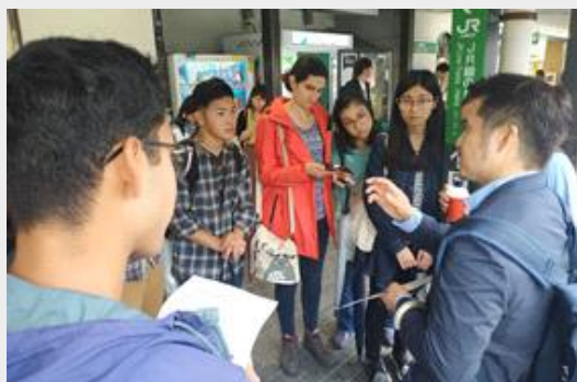
校外教學車站集合