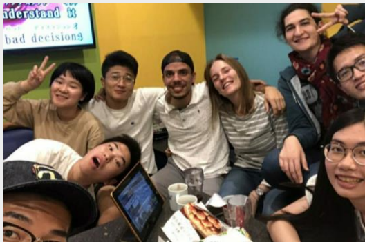
日本 KTV 徹夜高歌