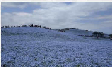
常陸海濱公園粉蝶花海

日本各季節花海也常常另人矚目結舌，在春季的賞櫻行程及夏季的各式祭典及煙火大會都是令人印象深刻的體驗。