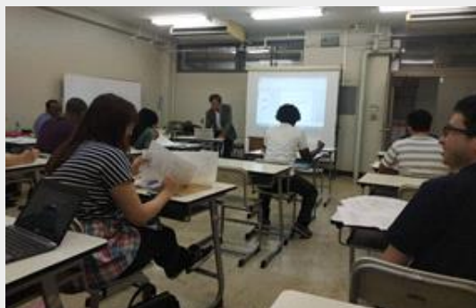
英文授課課程的外籍生們