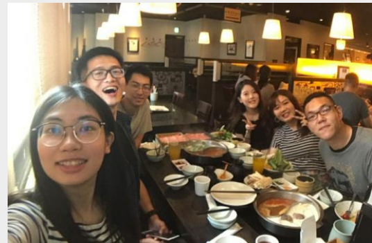
台灣留學生會聚餐

日本各季節花海也常常另人矚目結舌，在春季的賞櫻行程及夏季的各式祭典及煙火大會都是令人印象深刻的體驗。