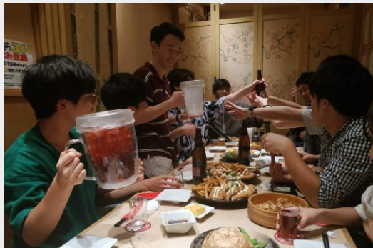
研究室期末居酒屋聚餐