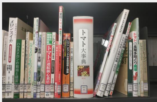
學校圖書館豐富書籍

每週出去玩累了之後，也可以選擇一些靜態活動， 學校圖書館 多達五層，可以在裡面選擇喜歡的書籍及影片進行觀看，或者到附近 神社寺廟 裡或 私人庭院 中，欣賞日本傳統建築並點一份甜點熱茶享受一整個下午的寧靜。