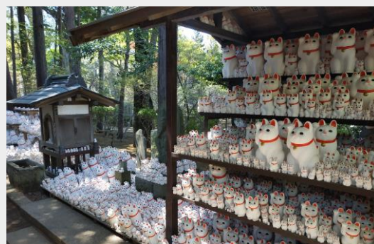
充滿招財貓的豪德寺

除了各種景點外，日本的美食也絕對不能錯過。鹹食的有 豚骨拉麵 、 牛肉蓋飯 、 炸天婦羅 等，甜點的 聖代 、 鬆餅 、 水果蛋糕 都令人難以忘懷。