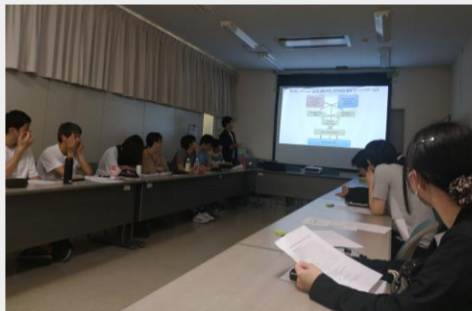
研究室每週實驗報告