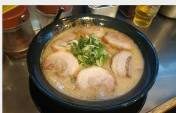
池袋無敵家豚骨拉麵

除了各種景點外，日本的美食也絕對不能錯過。鹹食的有 豚骨拉麵 、 牛肉蓋飯 、 炸天婦羅 等，甜點的 聖代 、 鬆餅 、 水果蛋糕 都令人難以忘懷。