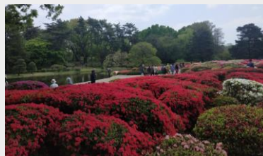
神代植物園杜鵑花海