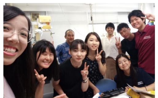
與居酒屋的老闆、老闆娘和女兒 在大學祭遇到社團朋友