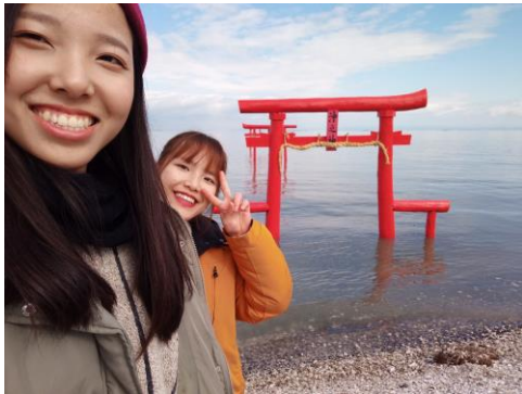
與越南朋友相約台灣見

在台灣也能在社團、科系中找到志趣相投的朋友，但到了日本，遇到了除了聊得來的朋友外，也有和自己一樣愛旅遊的人，能和這些朋友一起旅遊真的是這輩子非常珍貴的回憶，而我們也相約了明年再次相見!