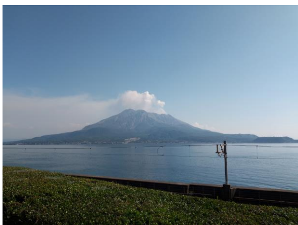
從仙巖園拍的櫻島

在去鹿兒島大學之前，包括申請到準備出國要做的事情其實滿繁複的，因此我把許多建議整理在這個部落格中 http://jenny98417rib.pixnet.net/blog ，希望能降低之後要來鹿兒島大學同學的焦慮感，另外每位交換生都會配有一個學伴，負責幫助你辦一些手續或協助課業，所以也不用太擔心不會日語不知道怎麼去市役所或郵局等等。最後也非常謝謝國際事務處讓我有這個機會到鹿兒島大學交換，也非常感謝父母在經濟上的資助，能有這樣的國外生活體驗真的非常值得!