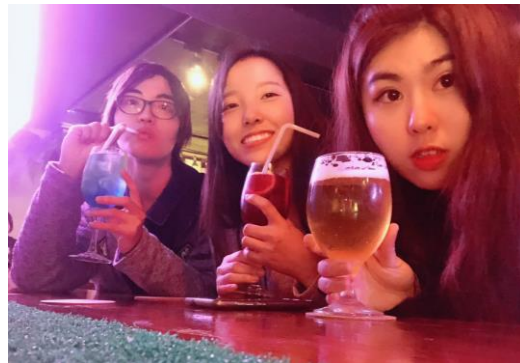
與愛旅遊的朋友相約印度見