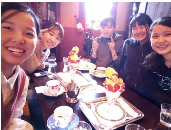
離開鹿兒島前與學伴和朋友的學伴聚餐