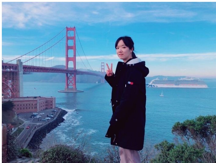
(Golden Gate Bridge, San Francisco)