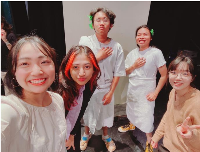
(與組員一起完成 Final 表演)

這是一堂互動課，老師非常活潑，很喜歡跟學生們互動、開一些可愛的玩笑。這門課是專門開給 GSP 交換生，一開始上課老師會請大家自我介紹，分享自己的科系及未來的想法，而且常需要分組表演，很容易就認識新朋友。透過上台表演不只訓練自己的英文發音，同時需要團體共同發揮想像力來完成作業。期末的表演大製作比較辛苦一點，不只要想出一個未開發的產品且要符合人類需求，還要編出一個短小的故事當成產品的廣告。準備過程雖然艱辛，光是道具就要以最低成本想辦法製作出來，還有故事的流暢度需要不斷改正。但是在最後一堂課觀賞各組表演的時候，會覺得一切都值得，大家的作品都值得多看幾次、非常之有趣。