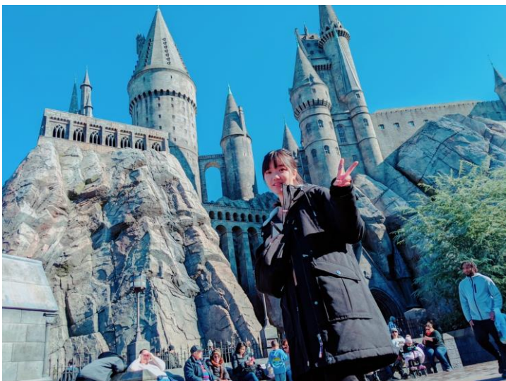
(Hogwarts, Universal, CA)