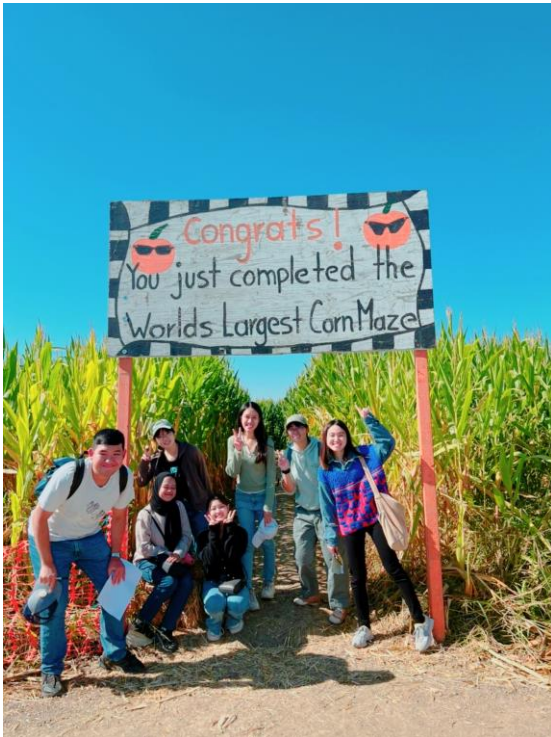
(GSP 舉辦的玉米田迷宮一日遊)

A. 校園: 戴維斯大學的福利非常棒，除了自習地點又多又舒服外，學校也提供免費的寫作諮詢處，想要寫英文 paper 或是小論文的人可以預約時段，幫助非常大。此外，學校很常舉辦一些交流或是一日遊的活動，透過活動可以認識一些新國際朋友。