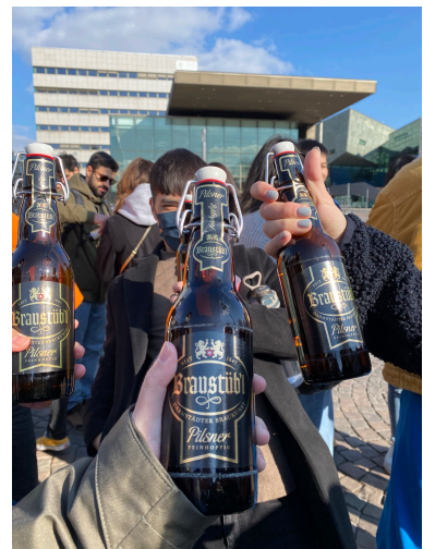
Prost!(乾杯) 達姆人最常喝的啤酒