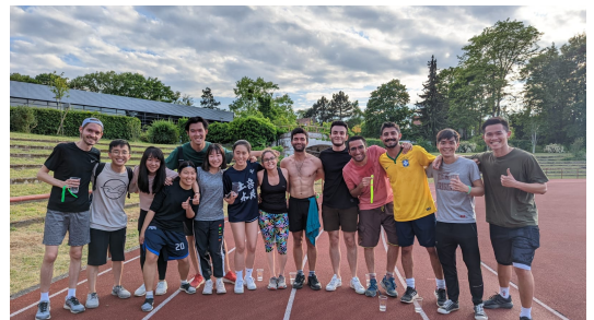
一起參加TU meet & move馬拉松接力