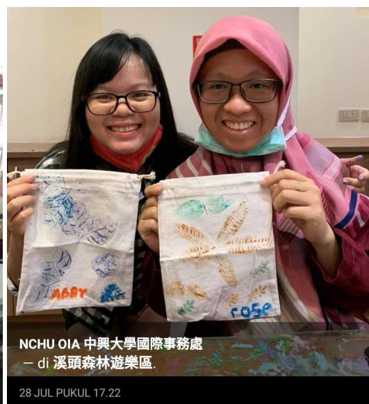
NCHU OIA 中興大學國際事務處 — di 溪頭森林遊樂區.