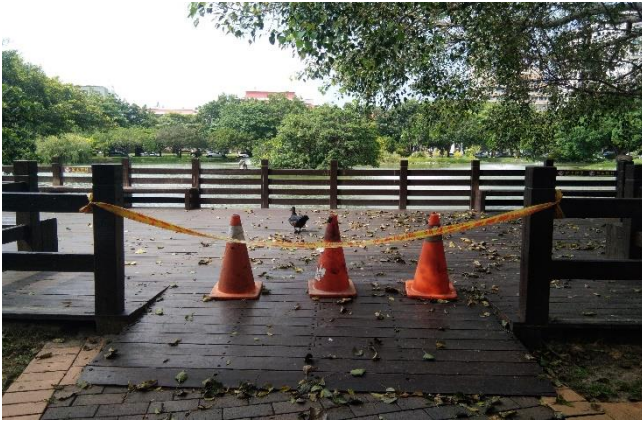
Mga upuang malapit sa NCHU lake ay hinarangan upang maiwasan ang pag-iipon ng mga tao dito.