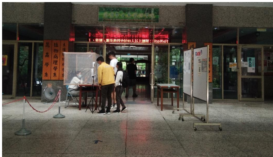
Istasyon para sa pagkuha ng temperatura at disimpeksyon sa pasukan sa gusali ng "Agrikultura at Likas na Yaman"