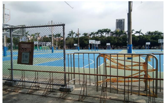
Maliban sa pangunahing pasukan ng unibersidad, lahat ng daang maaring mapasukan ay hinarangan [kaliwa]. Lahat ng pampublikong pasilidad ay isinara rin [kanan].