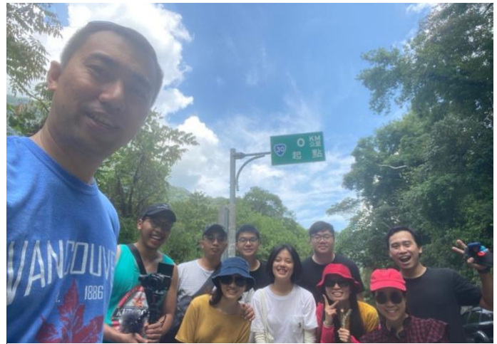
Taken during level 1

Trong tiếng Trung Quốc với tiếng Anh, có một thành ngữ “trong cái rủi có cái may”. Ở trong một hoàn cảnh khó khăn như vậy đã dạy cho mình một bài học quan trọng mà trước đây mình không nhận thấy. Cuộc sống thật ra rất mong manh, vì vậy chúng ta nên trân trọng từng giây từng phút của nó mà không coi bất cứ điều đơn giản nào là điều hiển nhiên. Mặc dù Đài Loan đã chứng tỏ khả năng của mình trong việc kiểm soát sự bùng phát với các quy