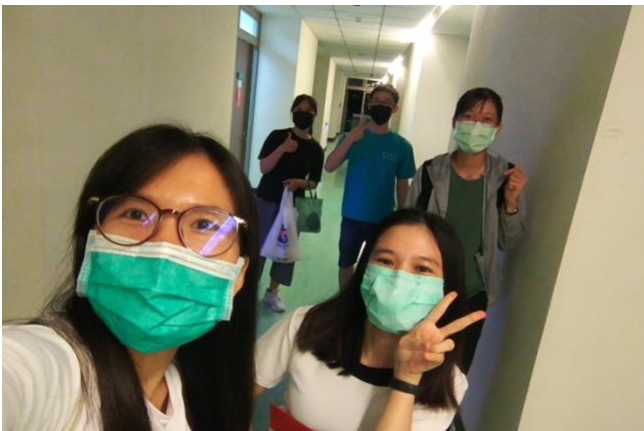
A good-bye is not for an end, but a new beginning

Ordering and Sharing Food was an icon of care during the pandemic