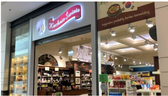
▲亞超 Kuchnie Świata