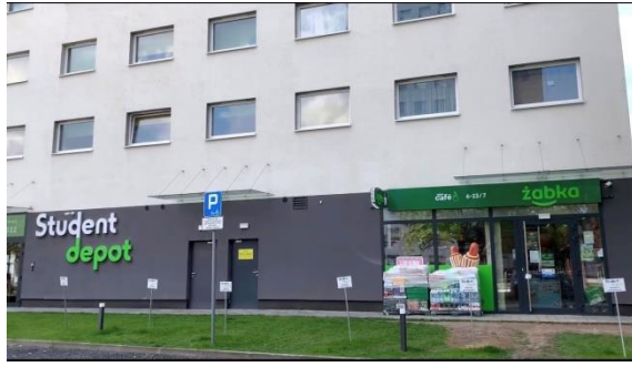
▲宿舍樓下就有的 zabka 小青蛙便利商店