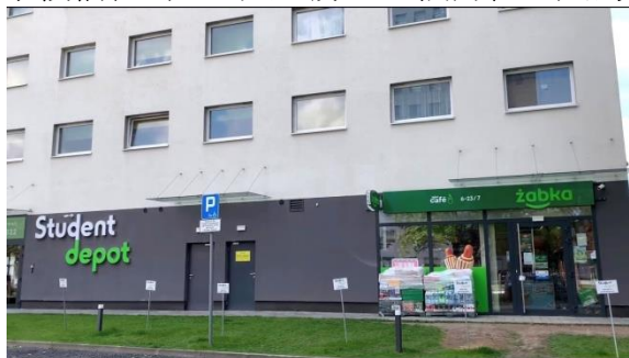
▲我住的宿舍 Student Depot Wrocław

學校宿舍為 2-3 人一房，一個月租金大約為 600 波幣(約台幣 4458)。