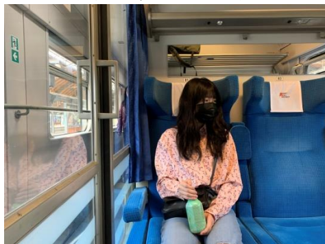
▲IC 火車(包廂式)(也有非包廂式的)