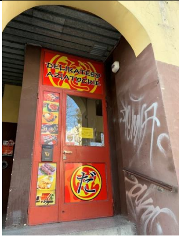
▲亞超 Delikatesy Azjatyckie