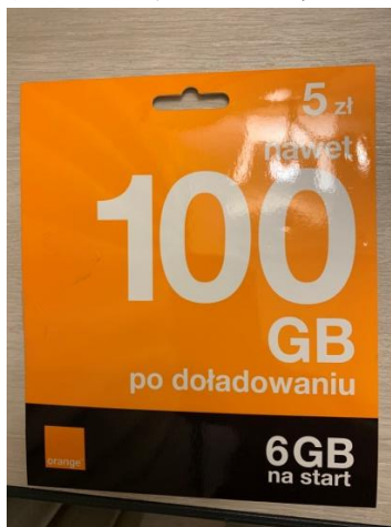
▲我使用的 Orange 電信 sim 卡

購買後，5 波幣 14 天可使用 6GB，之後儲值 30 波幣一個月可使用 15GB。