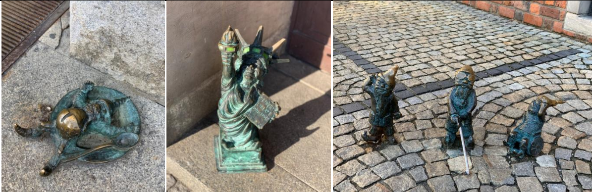
▲弗羅茨瓦夫逗趣的小矮人們