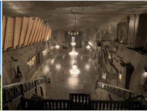
▲克拉克夫(Kraków)奧斯威辛集中營及維利奇卡鹽礦