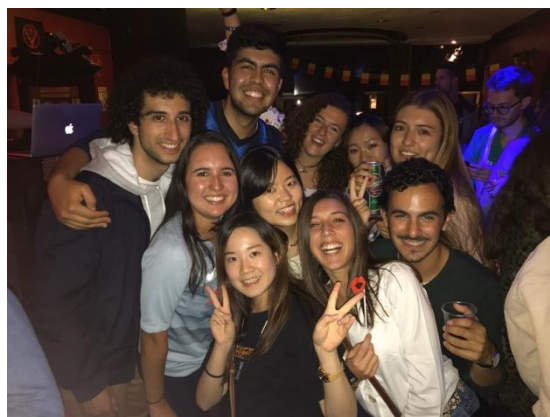
平 狀 國 迎