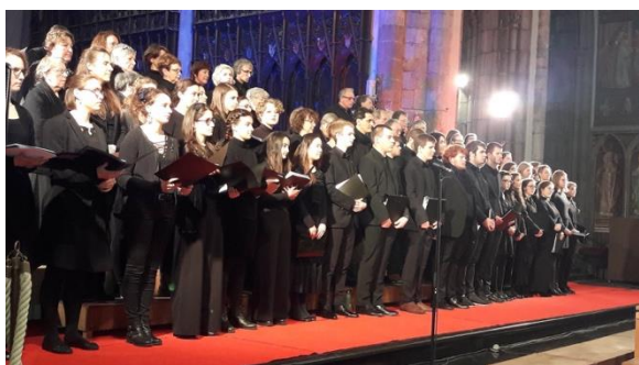
參加學校合唱團表演