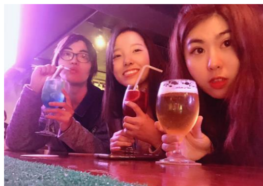
與愛旅遊的朋友相約印度見