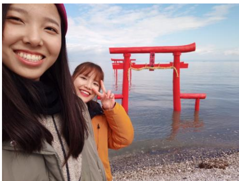
與越南朋友相約台灣見

在台灣也能在社團、科系中找到志趣相投的朋友，但到了日本，遇到了除了聊得來的朋友外，也有和自己一樣愛旅遊的人，能和這些朋友一起旅遊真的是這輩子非常珍貴的回憶，而我們也相約了明年再次相見!