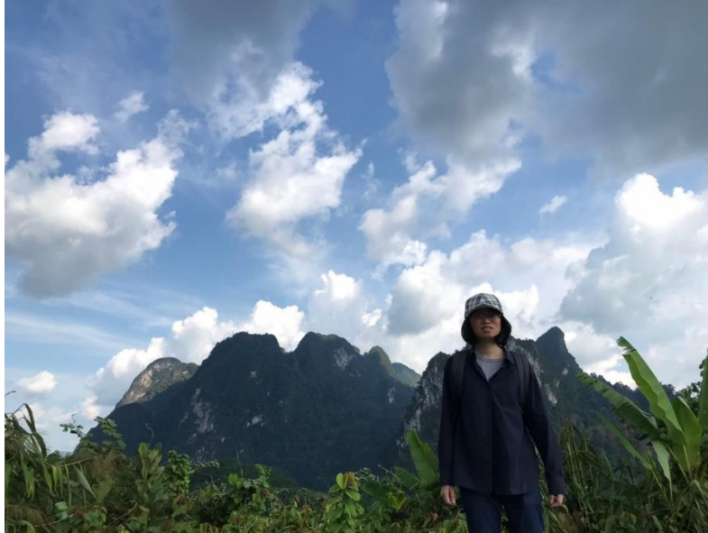
圖三:Khao Sok 旅行照

建議來泰國交換的學弟妹，除了在專業知識上的學習之外，也可以花一些時間到泰國各處走走看看，泰國有七十七個府，擁有多樣的地貌風景，利用課餘的時間到泰國各地旅行，也能豐富自己的閱歷。加上泰國是陸路國家，因此也可以體驗搭乘陸路交通工具進行跨國旅行樂趣。