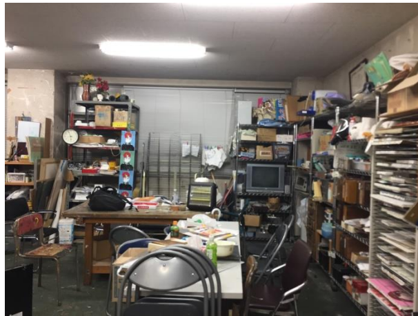
留有許多歡樂回憶的部室

雖然校內社團於秋學期不會進行招生，但可以留意張貼在高等教育推進機構或生協布告欄的傳單，直接連絡社團表明想觀摩或參加的意願。要注意的是，通常加入社團必須繳交社費(例如我參加的美術部年會費是6,000日圓)。平常不論上日文課或是 HUSTEP 課程都鮮少有與日本學生接觸的機會，如果想認識日本朋友的話，非常推薦參加社團。