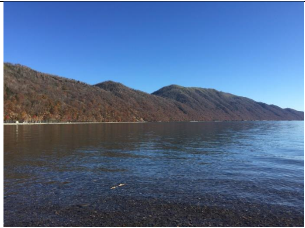
以校外教學為名的巴士旅行