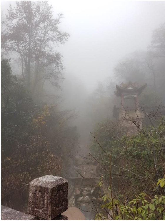
圖一、起大霧時美不勝收的黃山