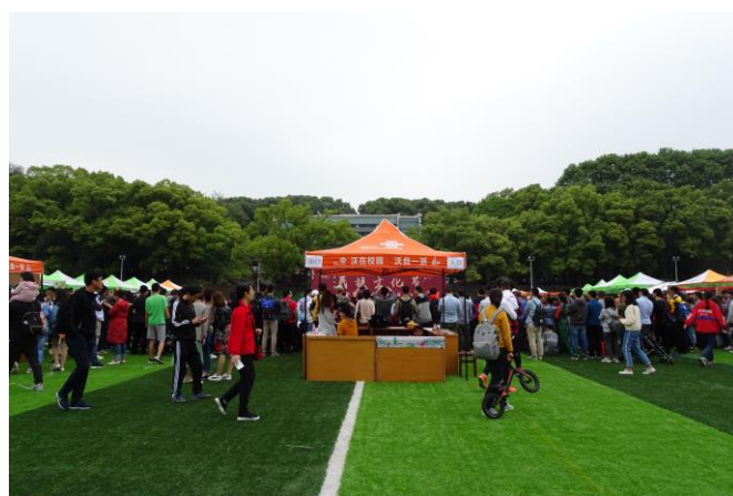
圖 7. 民族文化節場地。