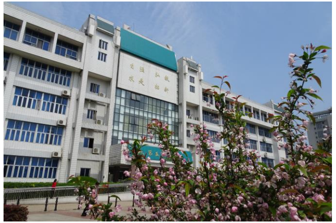
圖 1、2. 校訓就在你身邊。