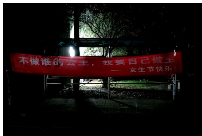
圖 6. 女生節橫幅。

交流期間，格外記得女生節與民族文化節，兩個頗感意外的慶祝活動。3/8 當天出門，發現各處懸掛紅布條橫幅，書寫各種逗趣撩妹標語，特別喜歡「不做誰的公主，我要自己作主」，也聽說清華曾出現「你的單醇讓我對你成醜」雙關梗，校園超市更祭出全場八折購物優惠。路過梅操偶遇民族文化節，親眼見證中國民族多樣性，我逛完攤位一次學習多個民族傳統習俗與特色飲食，中央包圍區域則輪番上陣精彩舞蹈表演。期末考試後，我們前往成都、長沙、西安遊覽，體會當地生活，並參觀博物館探索長江流域文明發展，更拜訪張家界與華山，徜徉山林風光，欣賞地理奇觀也鍛鍊體能。