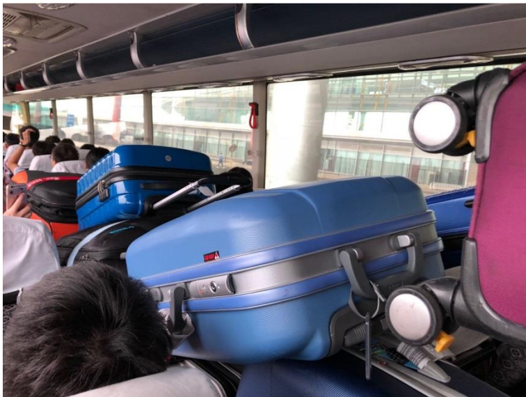
接駁車上滿載的行李

我有幸在學校的交換學生計畫獲得來到中國第一高等學府學習的機會，清華大學的學術聲望享譽國際，再來到北京之前我早就有所耳聞，而這次終於有機會能夠親身體驗，懷抱著既期待又忐忑的心情，我準備好要開始在園子裏為期半年的學習生活，期望在這段過程中能夠收穫滿滿，滿載而歸。