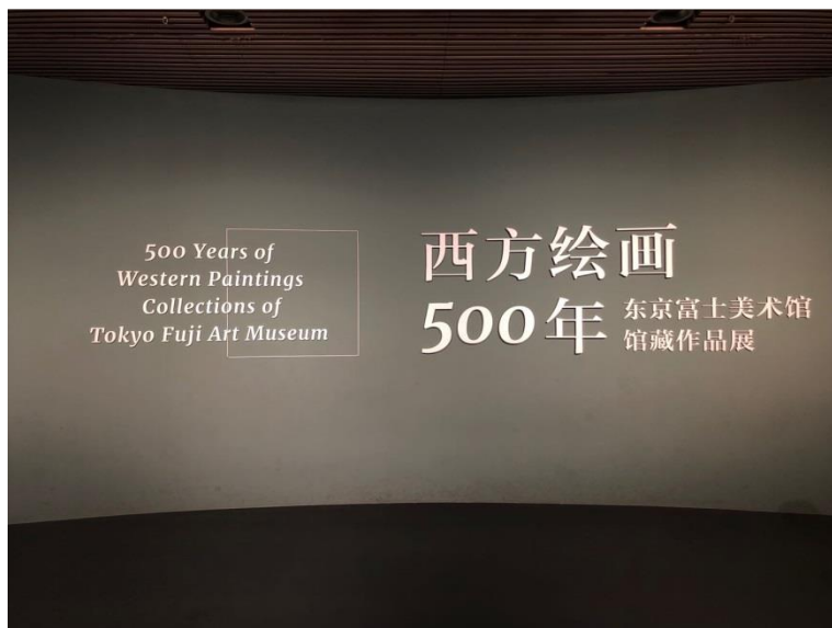
藝博展覽「西方繪畫500年」