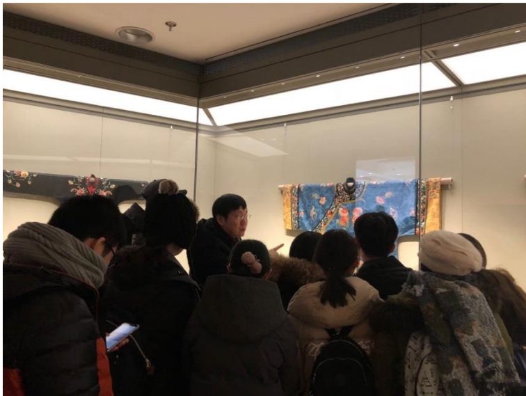
〈中外服裝史〉課程中，教授帶領我們至藝博參觀

清華的學習資源資源也是相當豐富，學校圖書館購買了大量的學術資料庫供不同科系使用，校內也設有多間圖書館，除了總圖之外，部分院系更有自己獨立的圖書館，像是美術學院就有自己的美院圖書館，裏頭的藏書也會更貼近院系需求。學校還有一座藝術博物館，校內學生參觀有優惠，除了一般的常設展外，不定期設有精彩的特展，像是交換期間藝博與東京富士美術館合辦的展覽就引起廣大的迴響，展覽結束前排隊的人潮更是令我為之驚艷，絕對是交換期間不可錯過的重要景點。校內還有設有新清華學堂，不時會有精彩的演出，從越劇到音樂會，甚至是電影，校內學生還能以優惠的價格購入門票，真的非常值得。