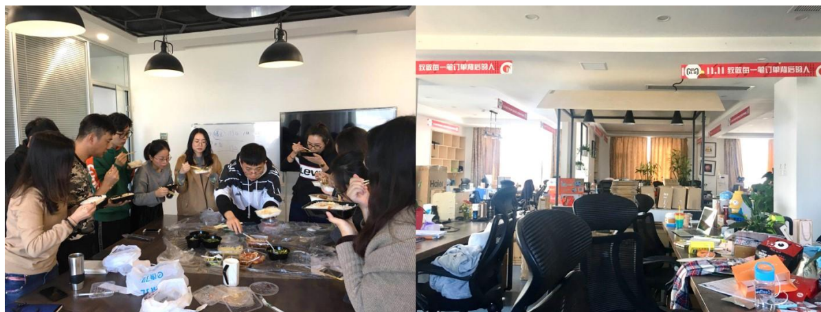
▲上圖為一起用午餐，及辦公室環境

身為大四生，接觸實務是很重要的，利用大陸實習 app-實習僧找到了實習。經過投遞履歷以及面試，有幸被天下網商錄取，該公司是以電商業務為主出版為輔，為阿里巴巴以及浙江出版合資。我實習的部門為品牌電商部，主要幫忙營運各品牌的微淘。跟在台灣不一樣的是，這邊的社群媒體以及渠道完全不同，基本上行銷操作大同小異，但好多術語一開始聽不懂，而且大多圍繞著淘寶轉，阿里巴巴規模真的太大了，涉及各方面。公司的同事都蠻親切的，也願意幫我解惑，雖然因為時間緣故，也沒有獲得直接對接客戶的機會，但基本上風險不大能讓實習生操作的部分，大家還是很願意放手讓我做。