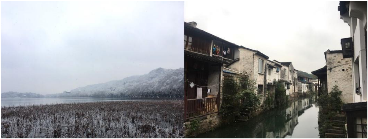
▲上圖為雪中的西湖殘荷，及紹興的江南水鄉風情