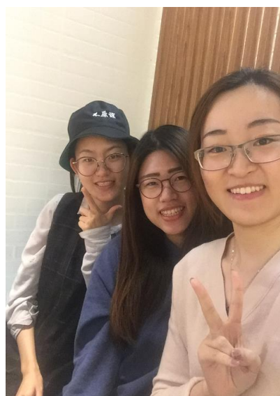
圖三:與大陸同學合照