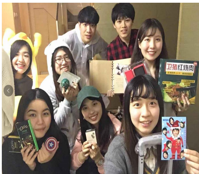
圖二:與台灣交換生合照