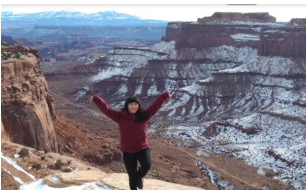
圖七：背景在 Canyonlands National Park

戶外活動：猶他州本來就是美國當地著名的滑雪勝地，對於生在熱帶國家的我，來這怎麼能不好好體驗滑雪和溜冰呢？雖然相較周圍的人，自己在新手區摸索自學跟笨蛋一樣，但當自己終於會轉彎、會煞車時真的是滿滿的成就感。州內也有幾個知名的國家公園值得去爬山、划獨木舟和露營，其中壯麗的自然景觀絕對不容錯過，在此也非常推薦學校的 outdoor program，花少少的錢，學校就會把器材、人員、食物、行程等全部安排好，非常方便也是認識朋友的好機會。