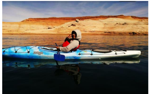
圖八：在 Lake Powell 划獨木舟