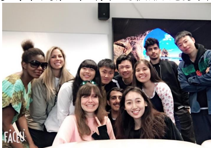
圖三：口說課的同學和老師

這學期我總共修了13學分，主要是 IELI 的英文和化學系的主修課程。儘管托福成績有通過門檻，但還是覺得自己英文需要更進步，所以有特別選修 Level 3 的口說和 Level 4 的文化交流綜合課程。課上除了有來自各國的同學，可以多多習慣不同的口音，老師也找來美國的同學當我們的助教，幫助課程的進行也使我更了解許多不同的美國文化，還會組織讀書會幫大家複習課程重點，真的獲益良多。老師的教學相較我以前的英文學習經驗真的活潑很多，課上會有很多小遊戲來學習常見的俚語，每堂課都有討論的主題，大家互相激盪想法，老師只會從旁幫助，像是提供好的單字片語等，而不是主導討論進行，對於我的口說幫助很大也交到許多各國的朋友。