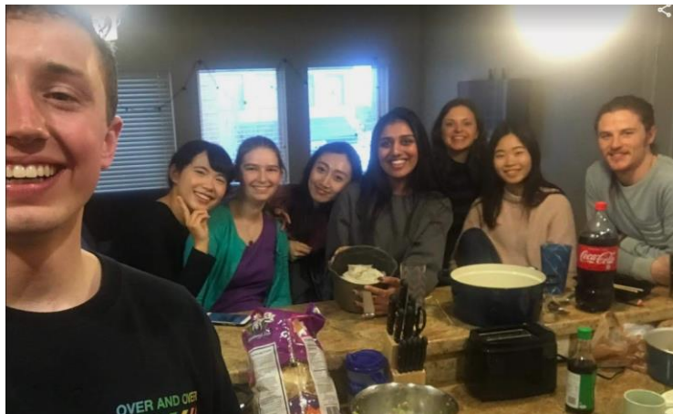
圖六：和朋友的餃子派對

食物：因為交換期間剛好是農曆過年，第一次在國外過年難免有點寂寞，所以特別邀請了我的國際友人來和我一起包餃子過新年，因為我是整個活動裡唯一會做的人，從食材的採買到包法教學，整場活動真的激發了我的無限潛能，不管是開車幾十公里，就只為了去亞洲超市買水餃皮，還是為了跟朋友介紹農曆新年的習俗或故事，學會了超多新單字，整個過程不僅僅是自我和知識的成長，也是非常好的文化交流。