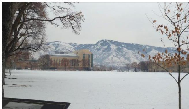
圖二：校園裡的大草坪