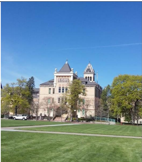
圖一：學校主校樓 Old Main