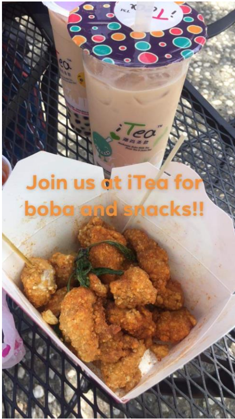
圖三、GSP 舉辦的聯誼活動