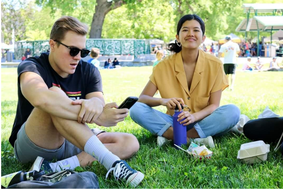
圖一、在 GSP 工作的美國學生

GSP 學生中有不少中國人、韓國人及日本人，雖然都為亞洲背景，但都用英文互相溝通，也是一個練習的機會。另外國際中心也時常舉辦活動，可以多加參與，認識不同國家的同學，一起體驗美國文化及 Davis 的活動。不論是春季班，可以享受一年一度最大的 picnic day 或者秋季班，雖然下著雨但享受萬聖節及聖誕節的重要節日，我認為能夠去感受國外氛圍，學習尊重不同文化背景，都是一個很好的經驗。