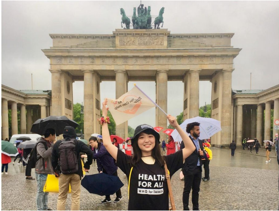
▲德國首都柏林地標之一—布蘭登堡門