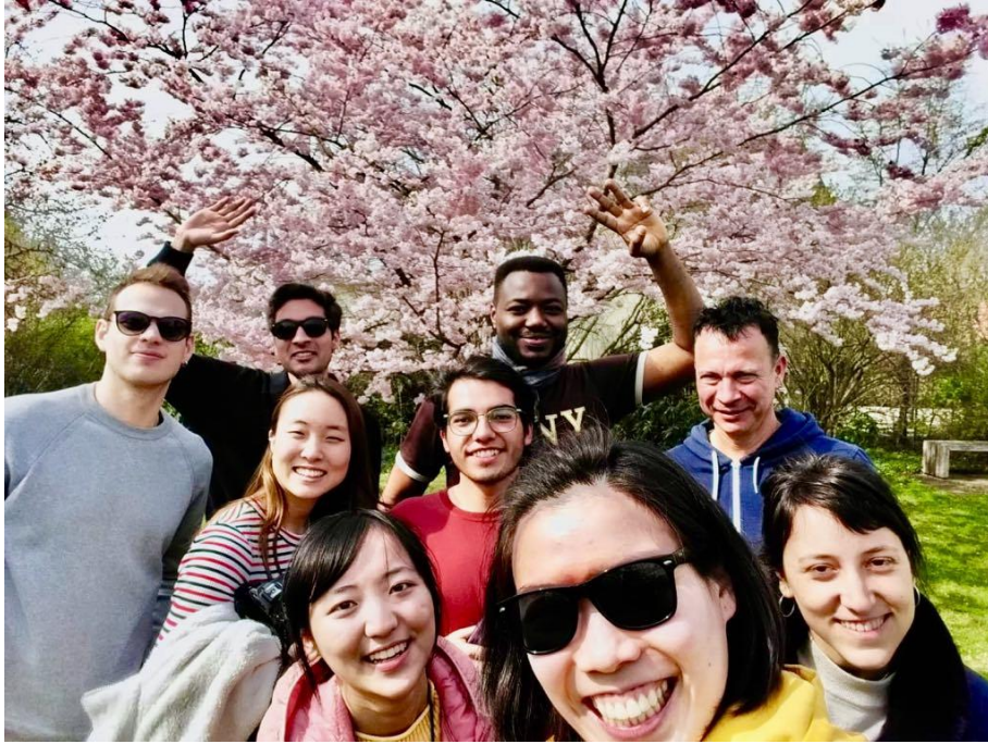
▲德文老師帶全班出遊