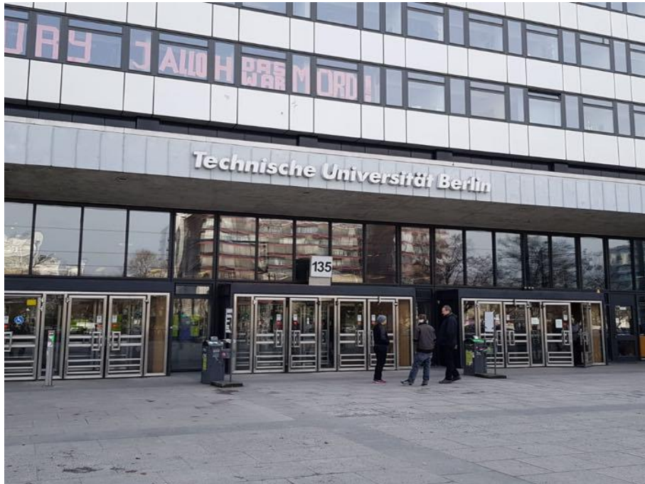
▲德國柏林工業大學主樓