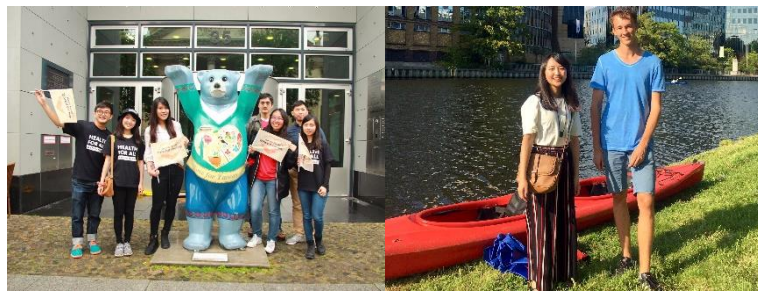
▲與台灣人共同參加遊行、和德國 Buddy 划船