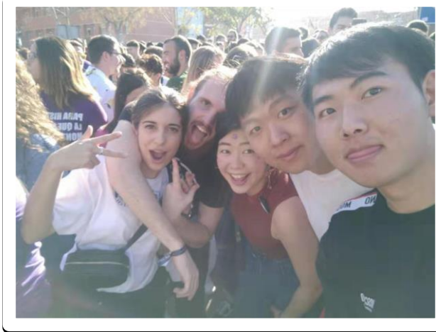
(學校 paella 節相當於校慶)