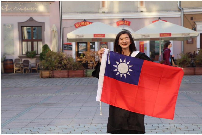
- 國慶日十月十日當天拿著國旗去老城區拍照