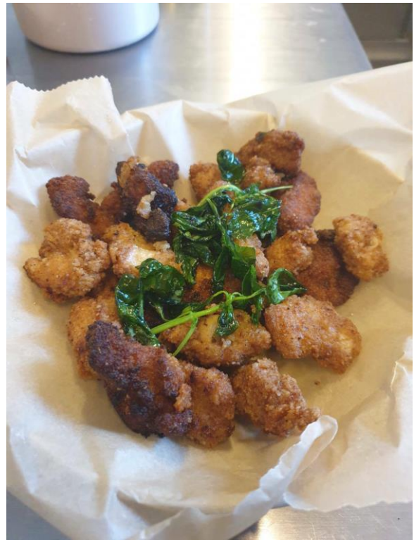
炸鹽酥雞給德文班同學吃