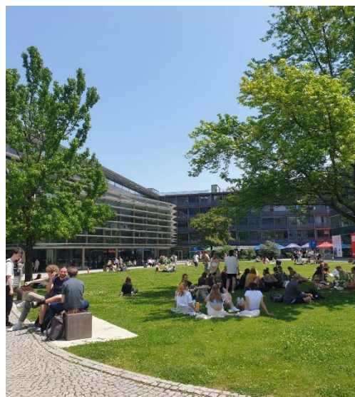
在 SOWI 聊天野餐的學生