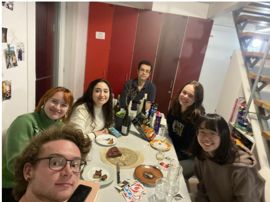
▲室友的生日派對合照

我所居住的學生宿舍是七人宿舍，由四個德國人、一個巴勒斯坦人、一個比利時人與我組成，我與室友們常常會在餐廳交流，假日有機會也會一起看電影、做飯與出遊。在多人宿舍中我學習到了如何和人相處，並且也了解他們的文化。