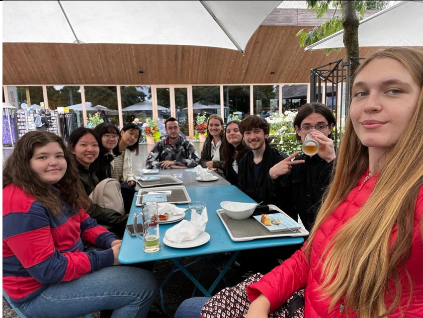
▲與語言班同學們的戶外教學合照