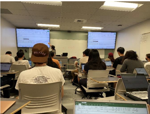
◀ 因課堂人數眾多，所以每週會小班制的助教課

這是一堂由管理學院開設的課程，在UC Davis 管理學院的課多數非常重視團隊合作，這堂課也不例外。教授利用一個商戰模擬教程Capsim帶入課程，將全班分成六組，每組代表市場上的一個公司，每周進行一回合的模擬，組員必須討論如何調整產品生產數量、定價、分配產能、預測競爭對手的策略等等以增加獲利，提高曝光度，提升公司市值。雖然只是一個模擬的市場，但對於沒有出過社會的我們來說，這是一個讓我們可以快速理解市場運作的管道，也因為沒有真正的獲利或損失，我們可以從錯的商業策略中學習並改進。