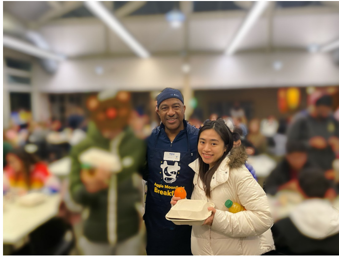
在aggie moonlight breakfast活動與校長的合照