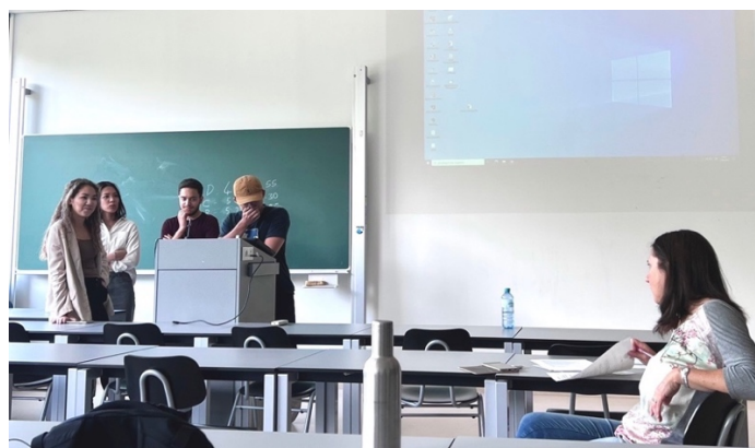
圖 3-2 期末報告發表後與老師聊天，組員為土耳其同學

相當喜歡這堂課的原因之一是國外同學總是很踴躍發表，可以趁機與他們切磋，即便你持有相反意見，相信對話依舊友善且正向。