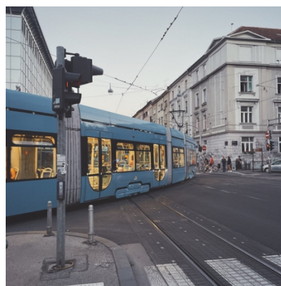
圖 4-4 Zagreb 街景