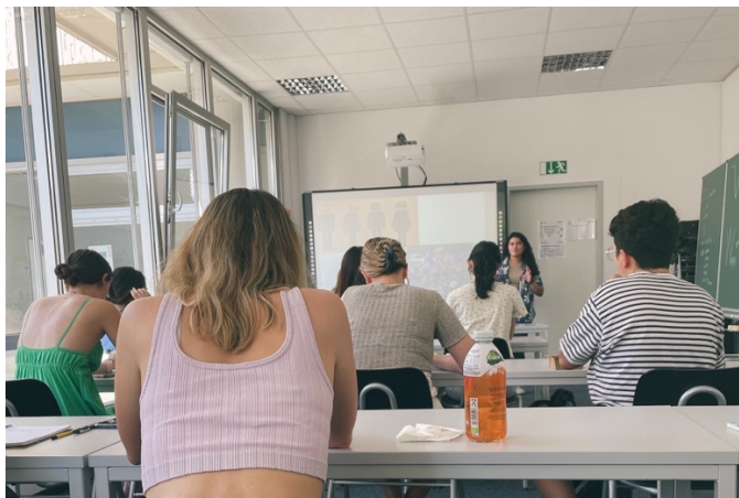
圖 3-1 Germay Today 同學發表其國家政治及文化