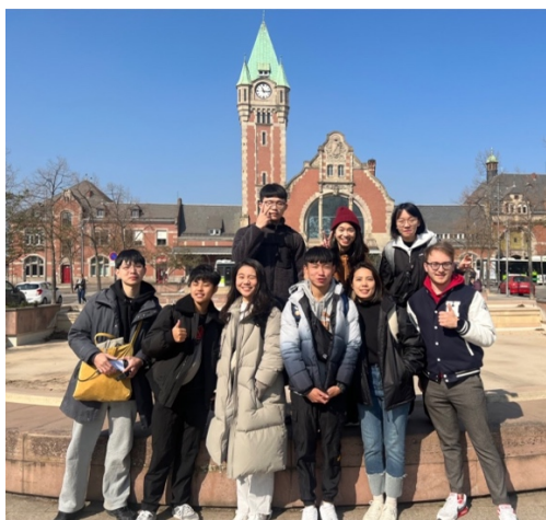
圖 4-1 台港德同學一起旅行

首先是交友方面，卡爾斯魯厄應用科大提供的 program 是專給國際學生的，因此修課的同學多是其他國家的學生。你可以在課堂上遇到各種國籍文化的同學，並且透過一次次的課堂、課外活動了解彼此，唯獨比較可惜的是我們去的時機點還在 covid 解封後沒多久，因此有許多學校原本的活動都停擺了；但是學校有個 buddy 的媒合可以讓我們在到達之前先藉由與 buddy 及其他國際生交流來了解交通、食宿、網卡等資訊。可以的話請偶爾跳脫原有的中文交友圈，多多認識其他國家的同學或是努力參加活動擴大人際網，也可以透過其他學校辦的活動，如：ESN，認識不同校的國際生或是德國人，為你的海外生活添加色彩吧！