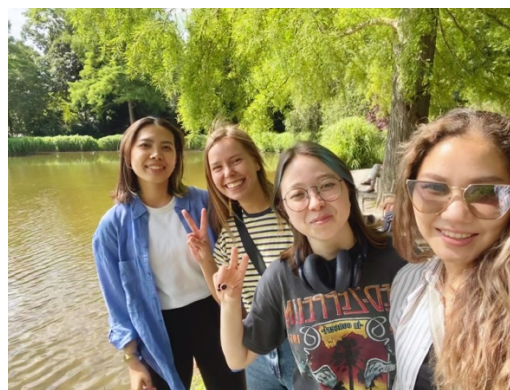
圖 4-2 與土耳其/丹麥同學公園野餐

旅行，是這趟交換研修不可或缺的元素。德國學校的學期較晚，鄰近的學校甚至晚我們一個月開學，但身為國際生的大家肯定會擠出許多時間出去旅行的！Ryan air 是歐洲最常使用的廉價航空首選，若是時間確定請記得儘早購票，價差非常的高！另外德國鐵路 DB 若要搭乘快車 ICE 也建議提早購票，歐洲的交通多是彈性定價，早買早享受，晚買沒折扣。