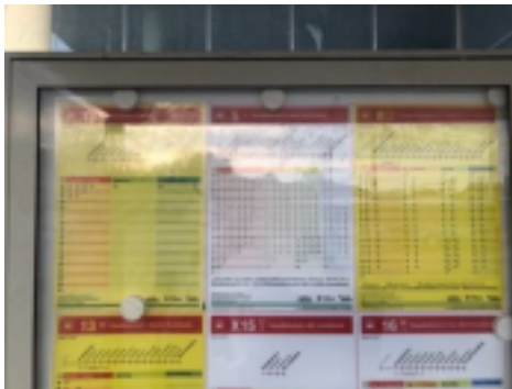
公車 公車的時刻表與路線