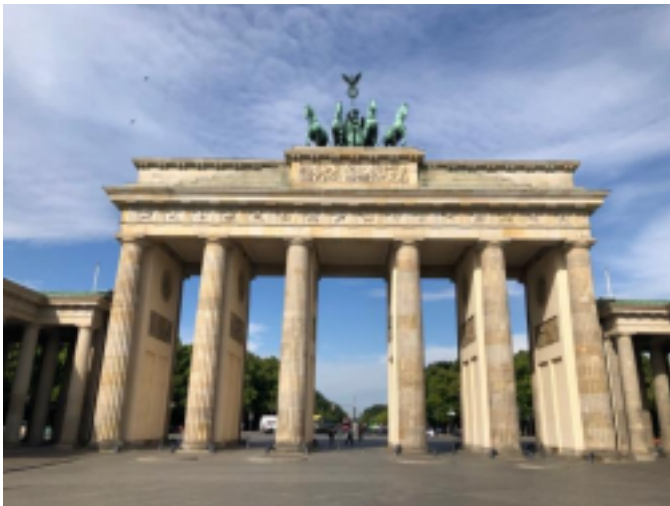
德國 國王湖 德國 柏林 布蘭登堡門