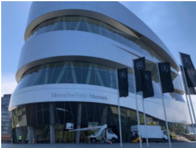
德國 慕尼黑 德國 斯圖加特 賓士博物館