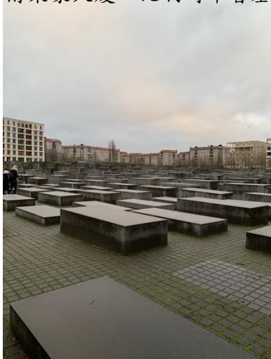
歐洲被害猶太人紀念碑，德國柏林