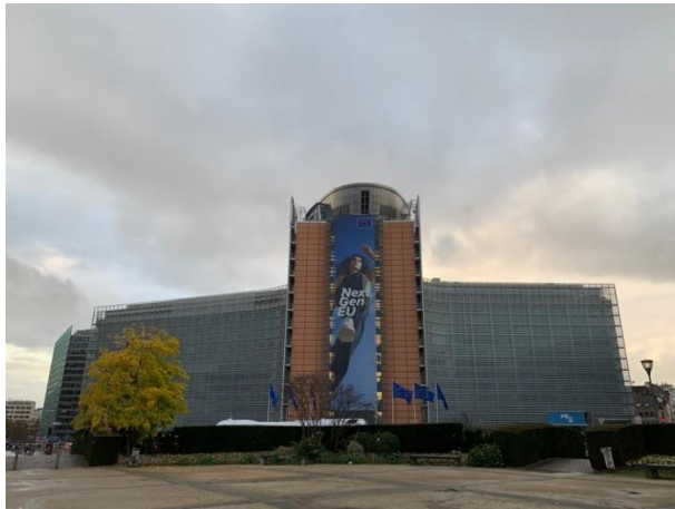
貝爾萊蒙大廈，比利時布魯塞爾

在歐洲可以透過申根簽證周遊列國，可以藉此參觀各國的博物館和名勝古蹟等，透過參觀各式各樣的博物館能夠更了解歐洲各國的歷史脈絡，也能從中發掘許多有趣的小故事。而歐洲各國的皇宮宮院與風景更是遠近馳名，在有限的時間內能夠走訪各地是這趟交換過程中難以忘懷的回憶。