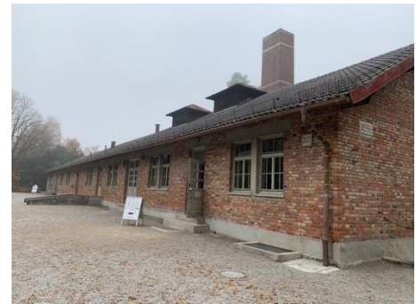
達郝集中營，德國達郝