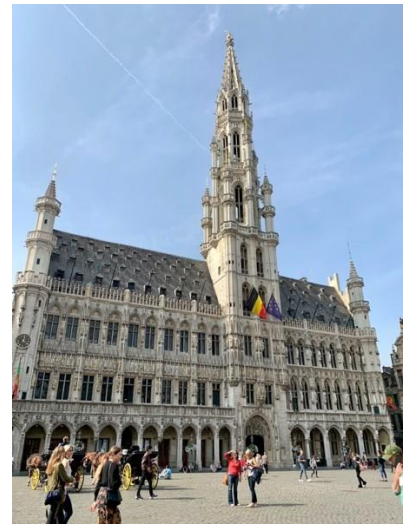
布魯塞爾市政廳，比利時布魯塞爾