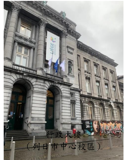
行政大樓 (列日市中心校區)