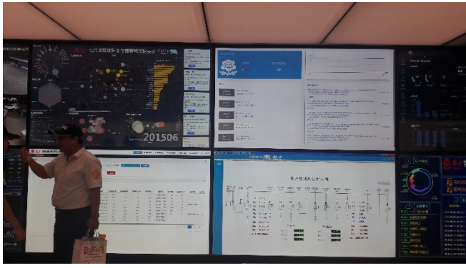
圖八、牡丹國企的參訪情形:利用互聯網進行調查消費者的行為分析)