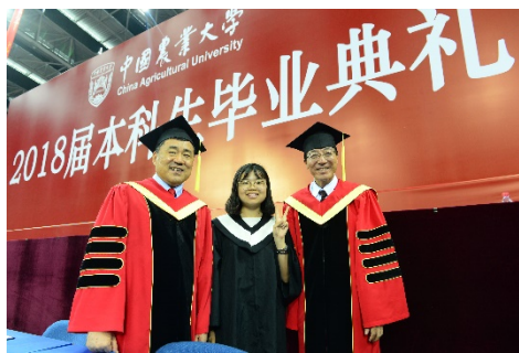
圖一、中農大畢業典禮(左為副書記，右為校長)