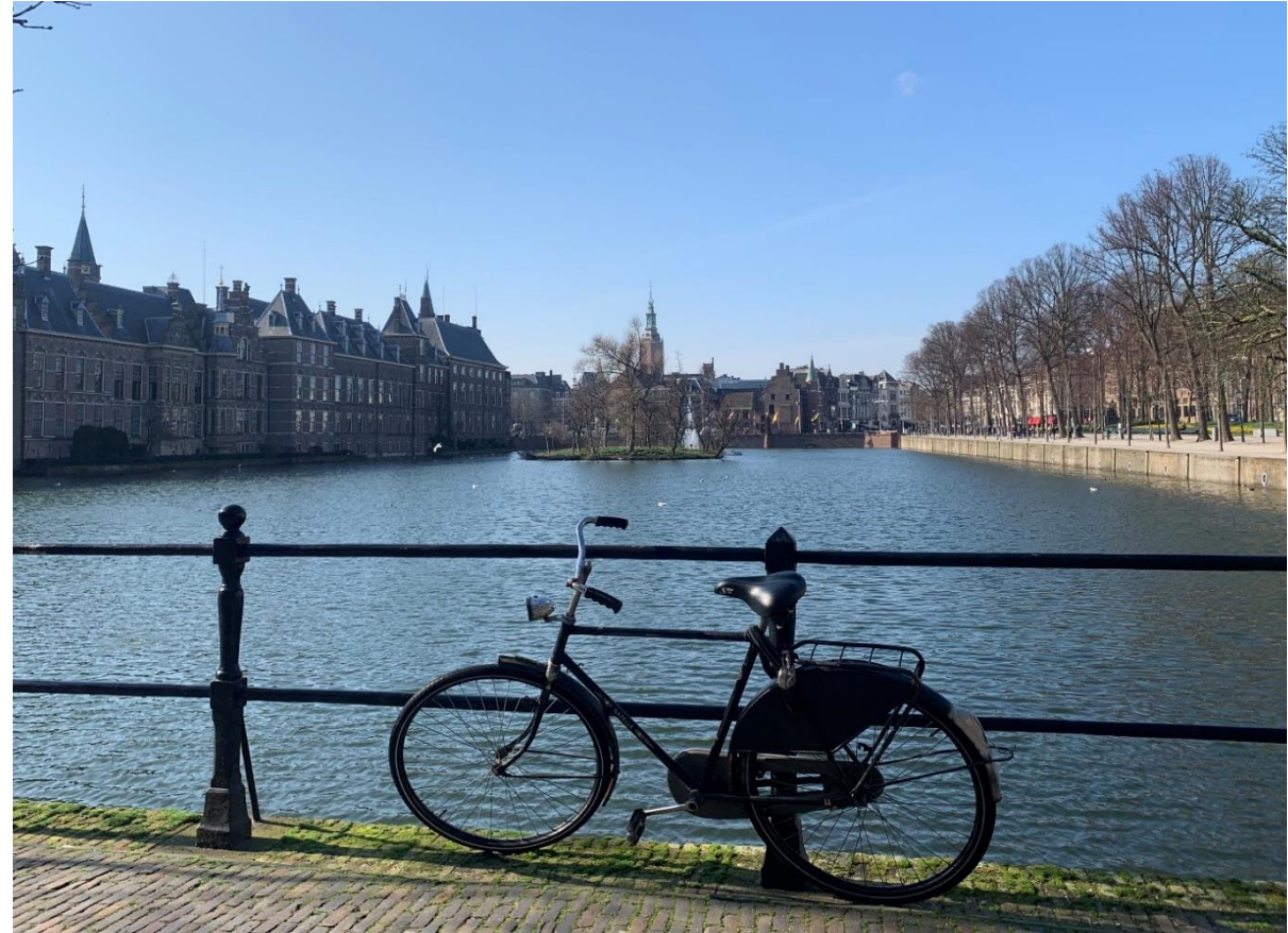
(上圖：荷蘭最常見的腳踏車樣子，沒有車籃、沒有手煞車、坐墊高度偏高，不一定會有後座。)

*若有購買或承租腳踏車，需注意是否有車燈。因為荷蘭法規似乎有規定，無車燈者會被罰款。學校裡租腳踏車的店有附車燈和車鎖。