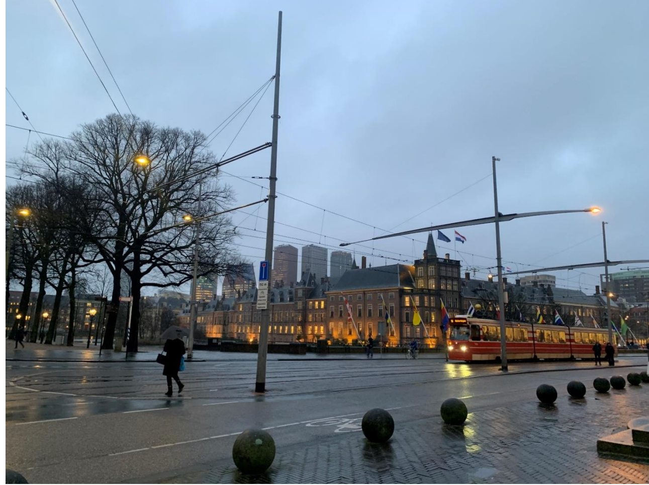
(上圖：海牙市區到處都是trams；2、3月的天氣總是下雨或陰天。)

9. 打招呼的習慣差別：回到台灣後，生活上我最想念大概是在歐洲不論到哪，一看到人、一走進一間店就會互相打招呼說Hello、Bonjour，結帳完、離開一間店時，店員一定會說Have a nice day；在學校不論是老師或同學，一起走在走廊上，第一句話通常是How are you？有時即便對方只是陌生人，或和自己再如何不熟悉，當自己在外時，這樣的打招呼總會讓人心裡莫名的覺得溫暖。