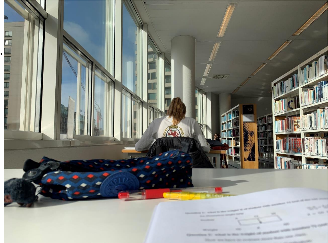
(上圖：海牙市中心的圖書館。一樓有咖啡廳、禮品店，還有很多關於荷蘭、海牙的旅遊簡介和介紹DM，很實用。)