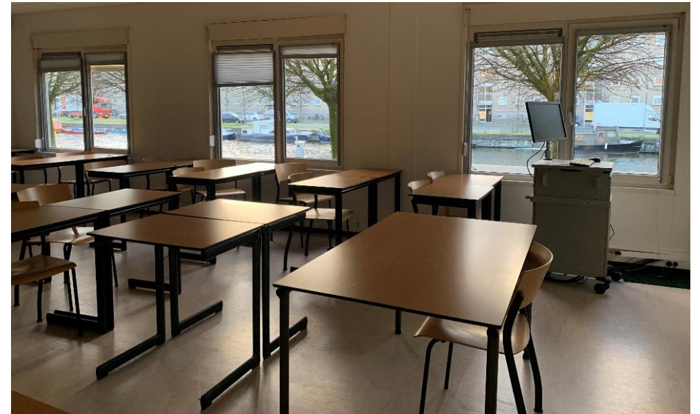
(右圖：某天法文課的教室。每次上課到不同的教室，如同在探險學校。)