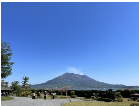
仙巖園&櫻島的美麗風景

鹿兒島市內有許多地方值得去，像是平川動物園、仙巖園、水族館、櫻島及城山展望台等等，風景都非常美麗。其中櫻島是我最喜歡的地方，渡輪 24 小時都有，而且船票單趟只要 200 日圓，15 分鐘就可以抵達櫻島。短短的 4 個月裡我就去了 4 次櫻島！而且鹿兒島市民還會有優惠券，可以免費體驗許多地方，包括動物園、水族館、美術館等等的地方喔~而鹿兒島市內也有很多溫泉可以體驗！另外中央站的 AMU PLAZA 和天文館通都是逛街的好選擇。