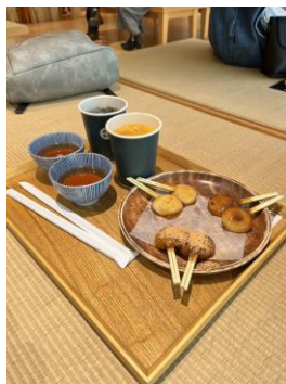
仙巖園記得要吃兩棒餅！