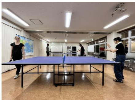
與朋友在會館開心打桌球！

我常常與朋友們在會館打桌球，也讓原本都不太打桌球的朋友們愛上桌球！另外，會館舉辦了一次桌球大賽，我得到了冠軍，應該也可以算是為臺灣爭光！能用運動跟大家交流真的超級開心，運動時覺得什麼煩惱都拋之腦後，非常放鬆。與朋友們在會館打桌球是我在鹿兒島最喜歡的休閒娛樂之一！