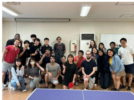
會館桌球大賽大合照