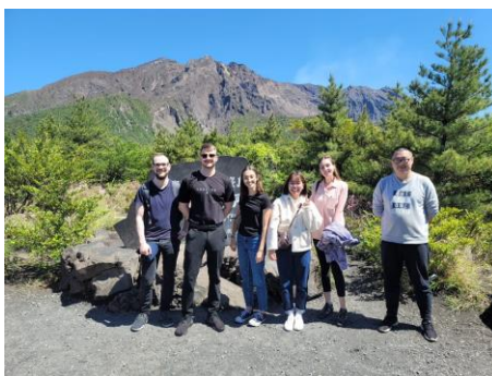
與朋友爬櫻島成功！