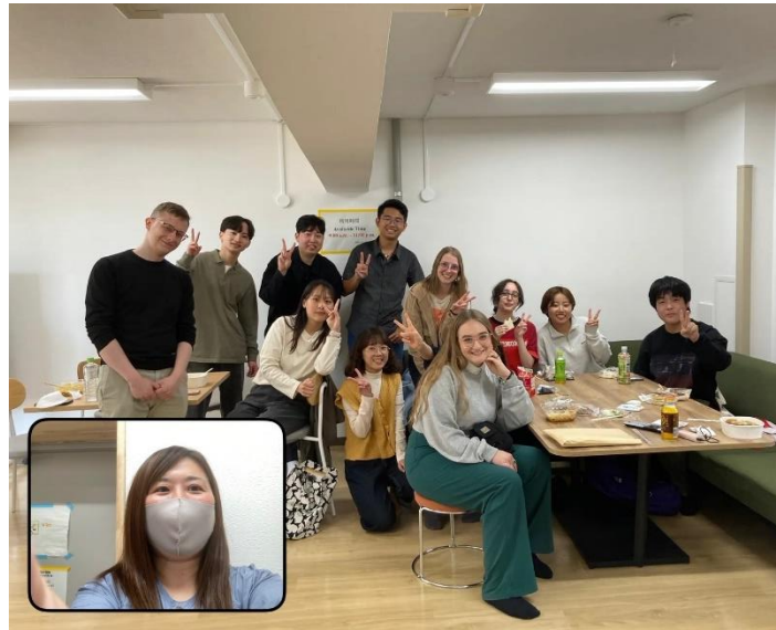
(總是熱鬧擁擠的 I-House 交誼廳)

用到日文，跟其他房的情況很不一樣。I-House 離學校很近，所以我們通常是走路上學，但許多當地學生或待比較久的國際生都會買一台腳踏車，方便騎去鄰近公園、餐廳、商家或超市購物。另外，I-House 第四棟樓下有一個交誼廳，來自各國的留學生沒事就會聚集在那裡，可能寫作業、做報告，或一起看電影、吃飯或聊天，偶爾也會小酌一下，總是很熱鬧。不過交誼廳只開放到晚上 11:00，警衛伯伯有時候都要去趕人。