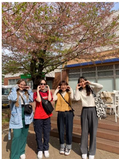
(埼大校園內的櫻花，可惜我們抵日時花期已經結束，正逐漸凋謝了。)

埼玉大學，是一所位於埼玉縣埼玉市櫻區的日本國立大學，簡稱埼大。1949 年由舊制浦和高等學校、埼玉師範學校、埼玉青年師範學校合併而成。在多年的發展中形成了以教養、教育、經濟、理學、工學等五大學院為主的多元化國立大學。埼玉大學致力於國際化，提供多種國際交流和學習機會，包括國際交換計劃，促進國際學術合作和跨文化交流。另外，埼玉大學距離東京約一小時的車程，除了交通便利，這個地理位置對於前往東京或其它周邊地區旅遊都非常方便。