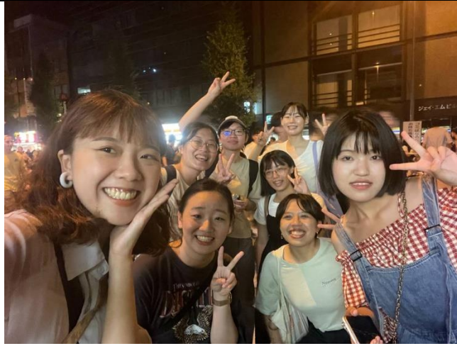
(跟日本朋友一起去看隅田川花火大會，聽說當晚總共湧入 103 萬人次。)