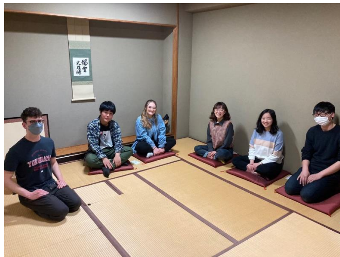
(表千家茶道部體驗)

剛抵達日本的第一天，埼玉大就有派「チューター」(Tutor)來接我們，讓我們在前往學校的路上不會太慌亂，畢竟從成田機場去埼玉大學需要大約兩個小時的車程，面對複雜的電車轉乘，初來乍到的外國人確實會看得一頭霧水。而我們在入境 14 天內一定要到附近公所辦好住民票，因此埼玉大也有派兩名 Tutor 帶著我們前往櫻區役所辦理。我剛到日本的時候日文沒有很好，所以一切都聽不懂，幸好我的 Tutor 們跟遇到的櫃台人員都很親切，每項程序都手把手的教我。不過因為每個人所配到的 Tutor 不同，所以相處方式都不太一樣，我的 Tutor 除了協助我們辦理在日手續，還進行校園巡禮、電車散步等活動，讓我們熟悉埼玉大校園及周邊生活環境，甚至帶我們去體驗茶道家，非常用心。