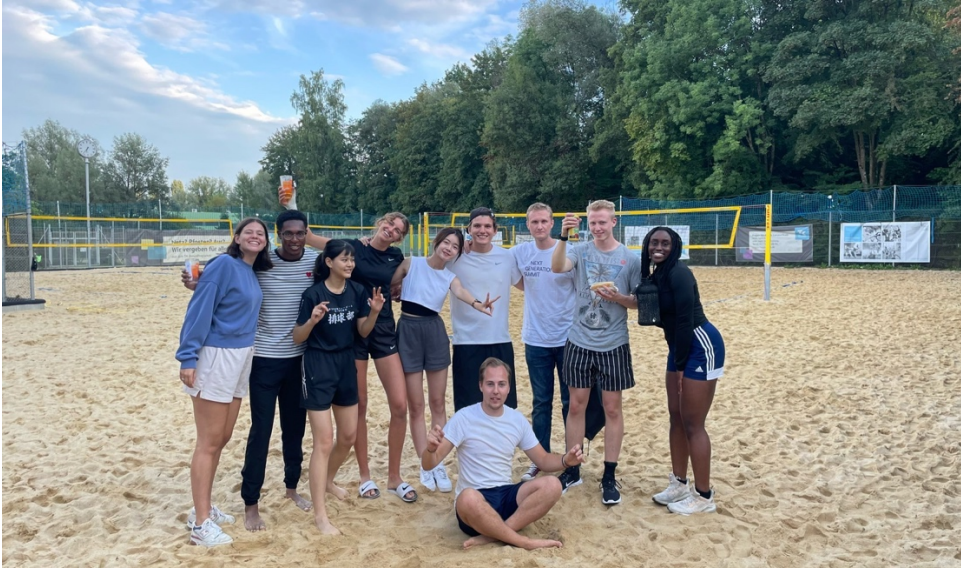
語言課第二週學校舉辦的沙灘排球比賽

上同學都會是相似的程度，每一個不同的班級會有不同的教學方式。我在的班級是 A2，老師基本上都是用德語教學，一個月下來我覺得我的聽力進步很多，同時有一些課堂活動可以和同學用德文對話，在台灣學習德文的時候基本上都是以閱讀和書寫為主，所以剛到德國時老師一直要我們開口說德文覺得很有挑戰，但是經過這一個月的密集課後，覺得自己也比較敢開口說話並不怕說錯了。