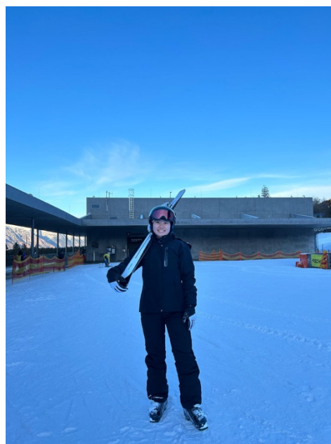
Ski in Patscherkofel ⇒