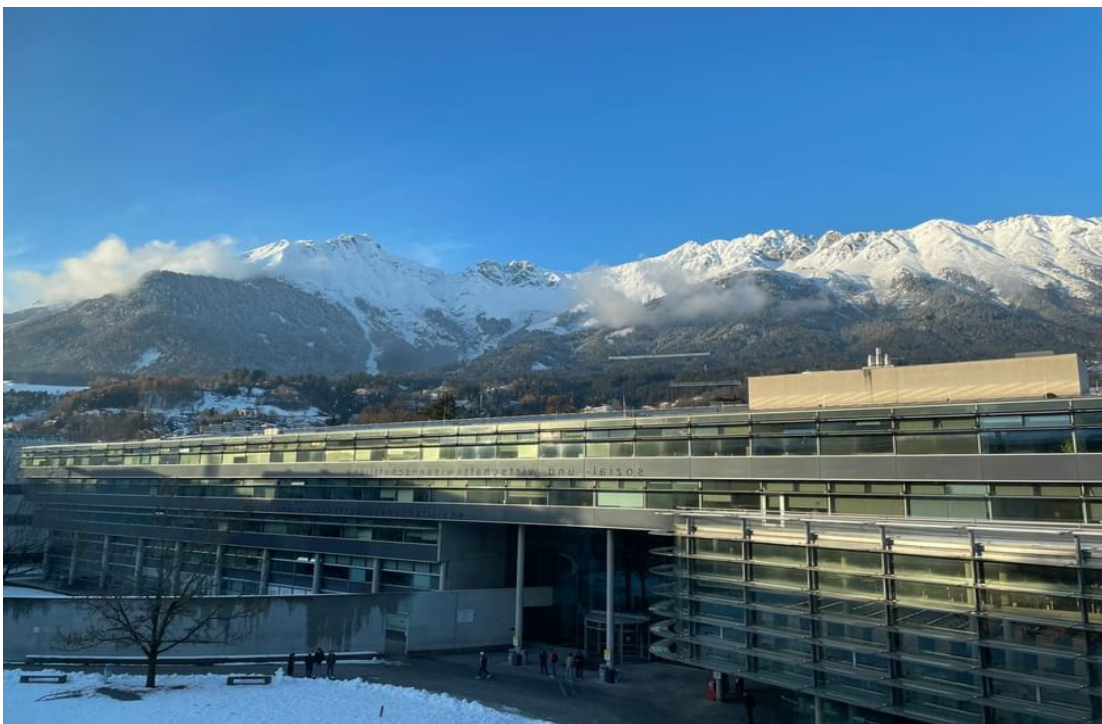
← SOWI 學院