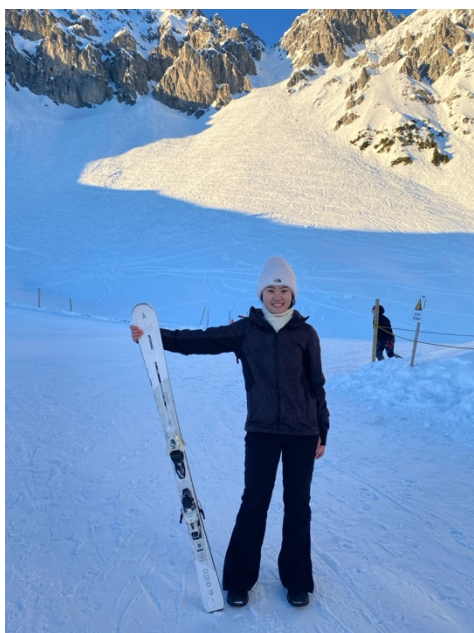
← 滑雪初體驗！ 在 Nordkette 上教練課

Innsbruck 是歐洲著名滑雪勝地！這裡曾舉辦過兩次冬季奧運，滑雪可以說是當地最熱門的戶外運動，從 11 月開始，就會在路上看到有人背著雪板全副武裝準備上山滑雪，大部分的人從小就開始學習滑雪，所以雪場總是有很多四、五歲的孩子在上滑雪課，小小身軀卻有不怕摔的勇氣，相當可愛！剛好我是冬季交換，有幸嘗試在台灣無法體驗的滑雪運動，初學者強力推薦要先上教練課，雖然學習過程中摔了好幾次，但還是可以明顯感受到自己正在慢慢進步；另外，滑雪所需裝備以及門票都不便宜，可以先體驗看看喜不喜歡，再決定要不要繼續投資滑雪裝備，像我一開始只準備雪板跟雪鞋，確定之後還會繼續滑，我才又購入雪杖、雪鏡、手套、外套跟雪褲；我只能說滑雪是我目前接觸過最喜歡的運動！推薦大家在課餘時間有機會的話可以嘗試滑雪，或許會像我一樣愛上唷！