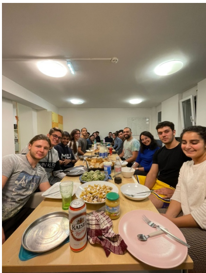
↑ International Dinner

體驗一個人在國外生活是我選擇交換的目的之一，在出發前做足功課、密集練習口說，提早一個月抵達 Innsbruck，努力適應當地生活；雖然剛開始還是會有些害怕開口說英文，但每次到廚房煮飯，鄰居們總是會聊個幾句，久而久之也慢慢學會外國人的 small talk，到現在反而是我會主動找人聊天！另外，我很推薦 Rössl 這間宿舍，這裡的每個樓層一定都會舉辦 International Dinner，光是我們這層就辦過三次，大家一起在廚房準備家鄉菜，每個人都非常用心且廚藝高超，三次的國際晚餐我分別準備珍珠奶茶、金沙杏鮑菇和麻油麵線煎，因為這個活動，讓我有機會品嚐到來自德國、印度、義大利、以色列、巴基斯坦、西班牙料理！