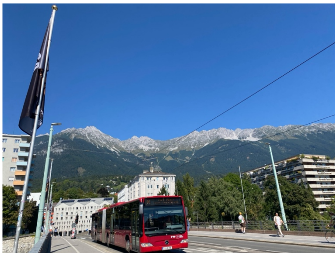
↑ 灰色屋頂的房子是 Rössl，宿舍後方就有美麗的山景

選擇出國交換是我目前做過最正確的決定，我很幸運可以申請到這間學校，認識一些很棒的外國朋友，這半年可以說是我目前度過最快樂的時光；如果你是個 Nature Lover，那麼 Innsbruck 大學會是很棒的選擇，整個小鎮被阿爾卑斯山包圍著，抬頭就可看到美麗的山景，我永遠記得我第一眼看到宿舍後方綿延的山群時，震驚到連自己誤闖腳踏車道都沒發現，還被後方腳踏車按鈴提醒。Innsbruck 的冬天可以滑雪、雪地健行，夏天可以爬山、騎車，一年四季有不同的戶外活動讓你可以好好認識 Innsbruck 的美，在交換的這半年裡，我去了很多國家、數不清的城市，但 Innsbruck 始終是我心中的 No.1！另外，保持 open-minded 的心態也很重要，遇到想認識、成為朋友的人，請務必好好把握機會，勇敢跨出第一步，釋出善意；世界很大，能遇見彼此是很難得的緣分，別讓你的害羞錯失任何一段珍貴的友誼！