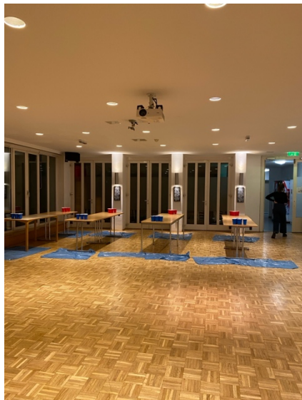
↑ 宿舍舉辦 Beer Pong Party

Innsbruck 是歐洲著名滑雪勝地！這裡曾舉辦過兩次冬季奧運，滑雪可以說是當地最熱門的戶外運動，從 11 月開始，就會在路上看到有人背著雪板全副武裝準備上山滑雪，大部分的人從小就開始學習滑雪，所以雪場總是有很多四、五歲的孩子在上滑雪課，小小身軀卻有不怕摔的勇氣，相當可愛！剛好我是冬季交換，有幸嘗試在台灣無法體驗的滑雪運動，初學者強力推薦要先上教練課，雖然學習過程中摔了好幾次，但還是可以明顯感受到自己正在慢慢進步；另外，滑雪所需裝備以及門票都不便宜，可以先體驗看看喜不喜歡，再決定要不要繼續投資滑雪裝備，像我一開始只準備雪板跟雪鞋，確定之後還會繼續滑，我才又購入雪杖、雪鏡、手套、外套跟雪褲；我只能說滑雪是我目前接觸過最喜歡的運動！推薦大家在課餘時間有機會的話可以嘗試滑雪，或許會像我一樣愛上唷！