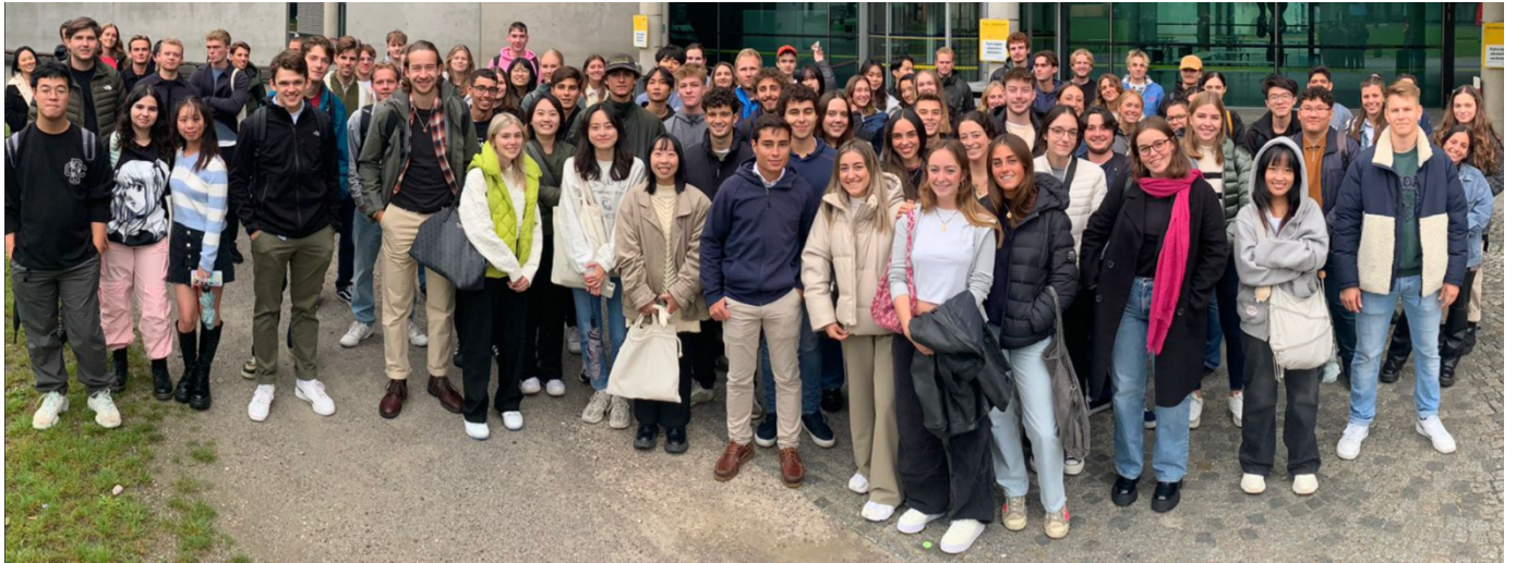
↑ SOWI 交換生第一次說明會