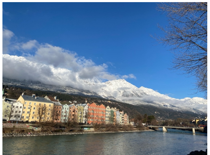
↑ Innsbruck 地標，彩色屋子後方山群就是 Nordkette