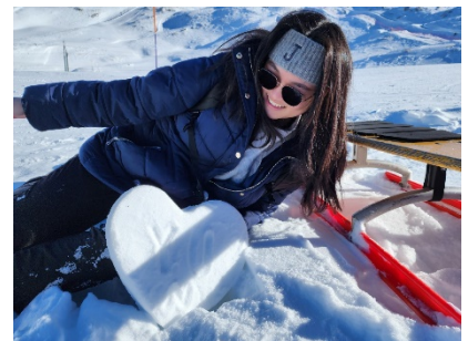
(瑞士 Gornergrat 山)

在閒暇時，我盡量頻繁地出遊。由於我購買了德國全境的 49 歐元月票，因此可以無限制地使用地區輕軌、地區火車和公車。多虧卡爾斯魯厄的地理位置，我們能夠經常拜訪朋友們特別喜歡的法國甜點店。這不僅讓旅遊變得更加輕鬆，同時也豐富了我的交換生活體驗。在短短六個月中，我體會到除了基本的防盜意識和處理問題的能力之外，旅遊時就應該盡情地欣賞這裡獨特的風景。例如:德國的教堂、瑞士的自然風光、奧地利的滑雪勝地以及義大利的神聖羅馬帝國遺跡等，都是我最懷念的景點。