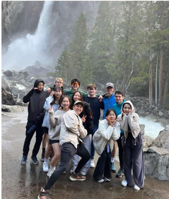
一起交換的好朋友們