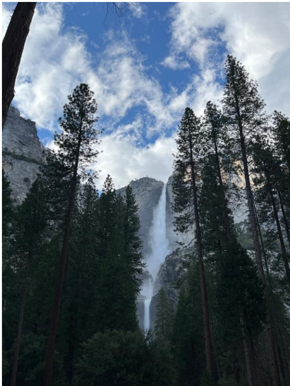
Lower Yosemite Fall

第一次跟交換的朋友們一起旅行， 我們選擇了距離學校車程約四個小時的 Yosemite ， 第二天總共爬了七個小時得山到達瀑布最高處， 很累但是風景真的很值得！