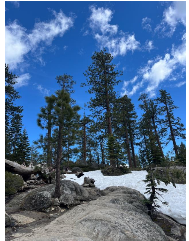
四月底尚未融完的雪