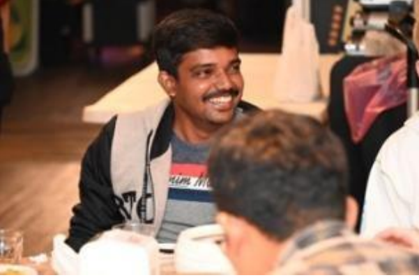
Photo during the NCHU year-end dinner party

NCHU ஆண்டு இறுதி இரவு விருந்தின் நபாது எடுக்கப்பட்ட புறகப்படம்