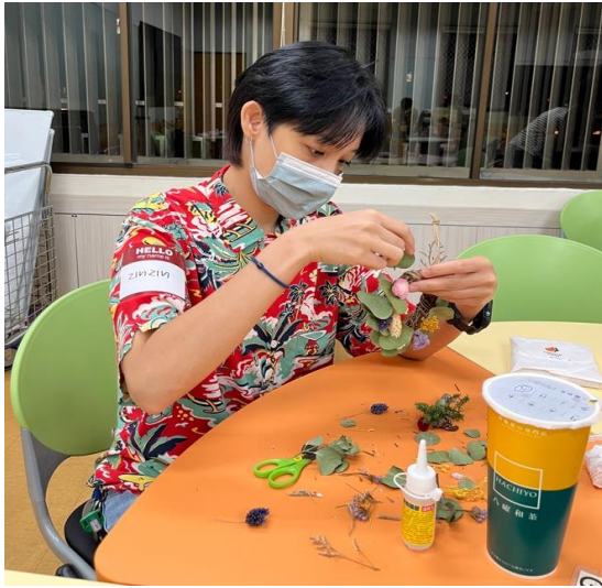
OIA's Christmas wreath DIY workshop.