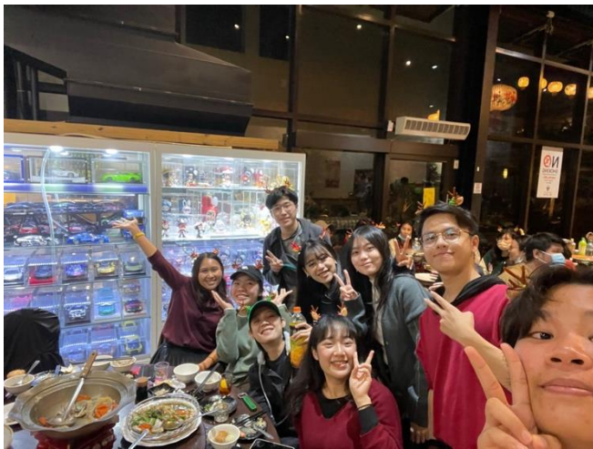
OIA's Christmas party!