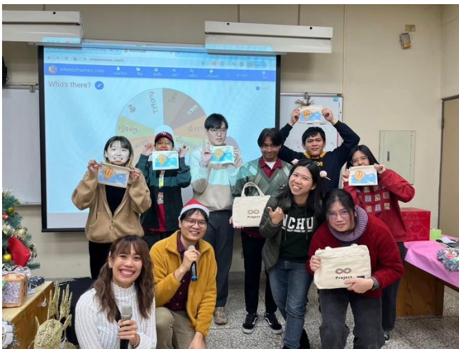
Thai students' event with OIA.