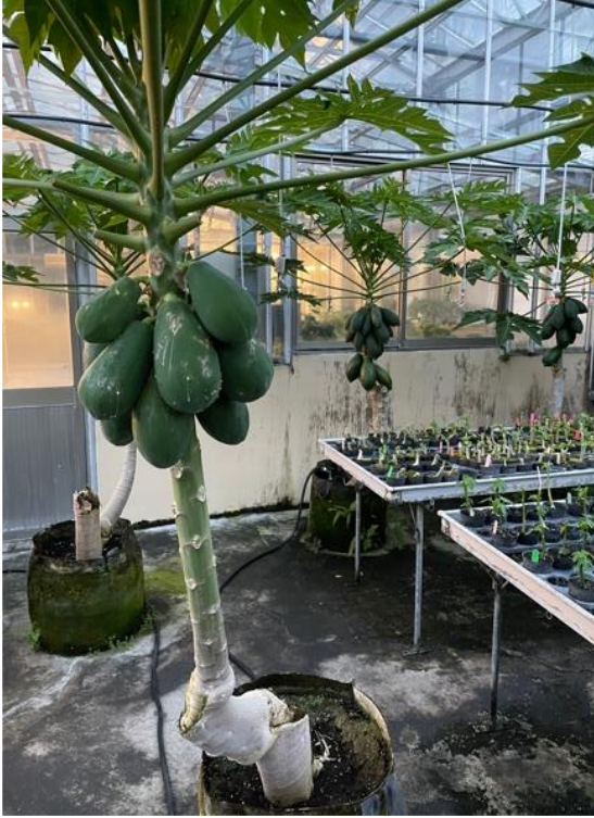
Papaya greenhouse in school nhà kính trồng đu đủ trong trường.