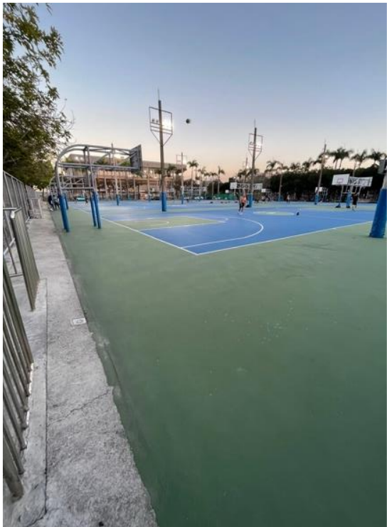
Basketball court. Sân bóng rổ.