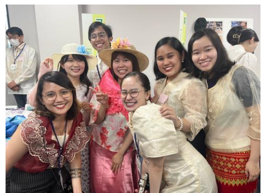
Hearty Party 體驗菲律賓服飾