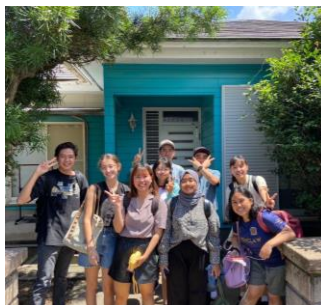
與朋友們去櫻島住一晚！煮了豐盛的晚餐