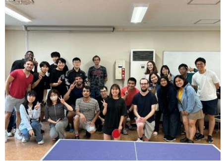
會館桌球大賽大合照