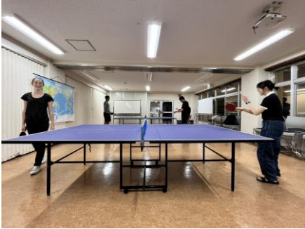
與朋友在會館開心打桌球！

我常常與朋友們在會館打桌球，也讓原本都不太打桌球的朋友們愛上桌球！另外，會館舉辦了一次桌球大賽，我得到了冠軍，應該也可以算是為臺灣爭光！能用運動跟大家交流真的超級開心，運動時覺得什麼煩惱都拋之腦後，非常放鬆。與朋友們在會館打桌球是我在鹿兒島最喜歡的休閒娛樂之一！