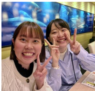
與 tutor 的合照

我很謝謝當初的我給了自己這個機會來申請交換，也幸運地來到鹿兒島。就算只有是短短的四個月，也創造出了數不清的美好回憶，我會將這些回憶全部好好地放在心裡。若是有人來問我，「你覺得要去交換嗎？」，我一定會毫不猶豫地說「去吧！」，能在學生時期去外面的世界增廣見聞真的很難得，所以不妨也給自己個機會去看看世界吧！