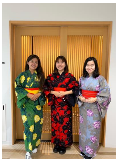
Hearty Party 體驗浴衣