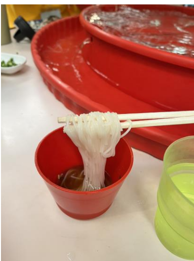
谷山一日遊體驗流水素麵

鹿兒島國際交流財團(KIEX)舉辦了許多活動，像是谷山一日遊及 Hearty Party，活動都非常充實也很用心，而且費用都很便宜，有些甚至是免費的！我參加完都覺得很感謝 KIEX 辦給我們這麼好的活動，留下很美好的回憶！