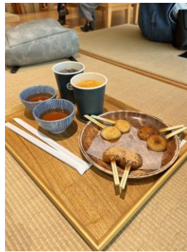
仙巖園記得要吃兩棒餅！