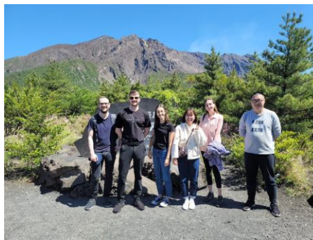
與朋友爬櫻島成功！