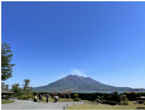
仙巖園&櫻島的美麗風景

鹿兒島市內有許多地方值得去，像是平川動物園、仙巖園、水族館、櫻島及城山展望台等等，風景都非常美麗。其中櫻島是我最喜歡的地方，渡輪 24 小時都有，而且船票單趟只要 200 日圓，15 分鐘就可以抵達櫻島。短短的 4 個月裡我就去了 4 次櫻島！而且鹿兒島市民還會有優惠券，可以免費體驗許多地方，包括動物園、水族館、美術館等等的地方喔~而鹿兒島市內也有很多溫泉可以體驗！另外中央站的 AMU PLAZA 和天文館通都是逛街的好選擇。