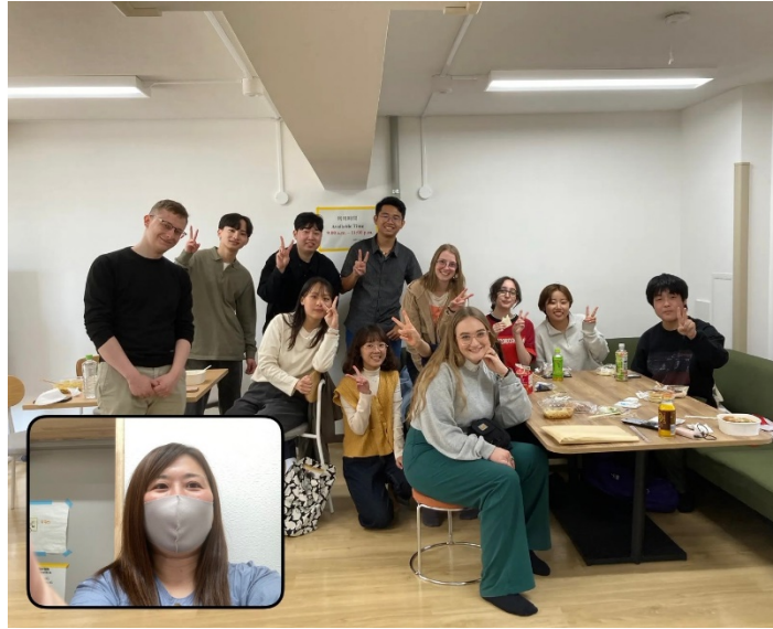
(總是熱鬧擁擠的 I-House 交誼廳)

用到日文，跟其他房的情況很不一樣。I-House 離學校很近，所以我們通常是走路上學，但許多當地學生或待比較久的國際生都會買一台腳踏車，方便騎去鄰近公園、餐廳、商家或超市購物。另外，I-House 第四棟樓下有一個交誼廳，來自各國的留學生沒事就會聚集在那裡，可能寫作業、做報告，或一起看電影、吃飯或聊天，偶爾也會小酌一下，總是很熱鬧。不過交誼廳只開放到晚上 11:00，警衛伯伯有時候都要去趕人。