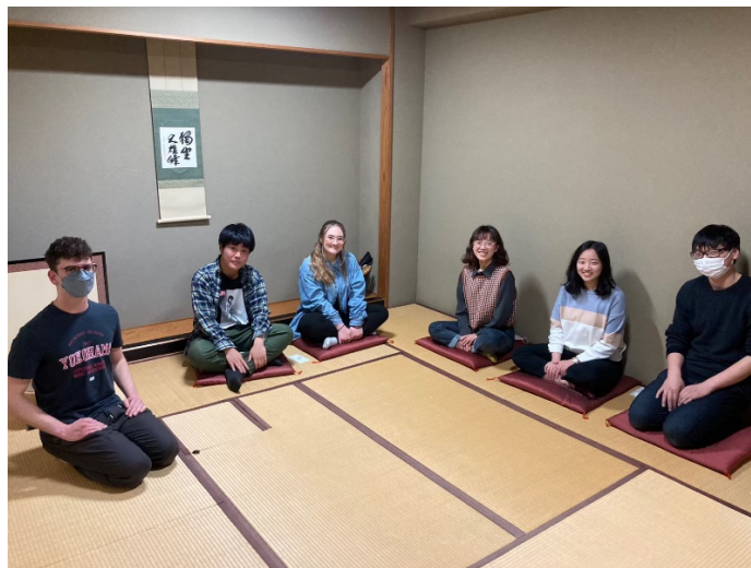
(表千家茶道部體驗)

剛抵達日本的第一天，埼玉大就有派「チューター」(Tutor)來接我們，讓我們在前往學校的路上不會太慌亂，畢竟從成田機場去埼玉大學需要大約兩個小時的車程，面對複雜的電車轉乘，初來乍到的外國人確實會看得一頭霧水。而我們在入境 14 天內一定要到附近公所辦好住民登記手續，因此埼玉大也有派兩名 Tutor 帶著我們前往櫻區役所辦理。我剛到日本的時候日文沒有很好，所以一切都聽不懂，幸好我的 Tutor 們跟遇到的櫃台人員都很親切，每項程序都手把手的教我。不過因為每個人所配到的 Tutor 不同，所以相處方式都不太一樣，我的 Tutor 除了協助我們辦理在日手續，還進行校園巡禮、電車散步等活動，讓我們熟悉埼玉大校園及周邊生活環境，甚至帶我們去體驗茶道社，非常用心。