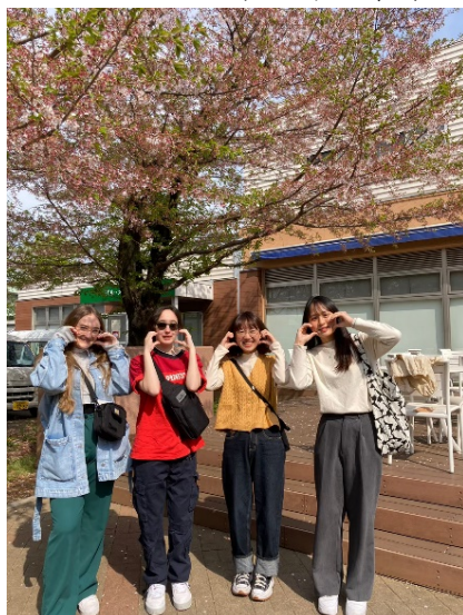
(埼大校園內的櫻花，可惜我們抵日時花期已經結束，正逐漸凋謝了。)

埼玉大學，是一所位於埼玉縣埼玉市櫻區的日本國立大學，簡稱埼大。1949 年由舊制浦和高等學校、埼玉師範學校、埼玉青年師範學校合併而成。在多年的發展中形成了以教養、教育、經濟、理學、工學等五大學院為主的多元化國立大學。埼玉大學致力於國際化，提供多種國際交流和學習機會，包括國際交換計劃，促進國際學術合作和跨文化交流。另外，埼玉大學距離東京約一小時的車程，除了交通便利，這個地理位置對於前往東京或其它周邊地區旅遊都非常方便。